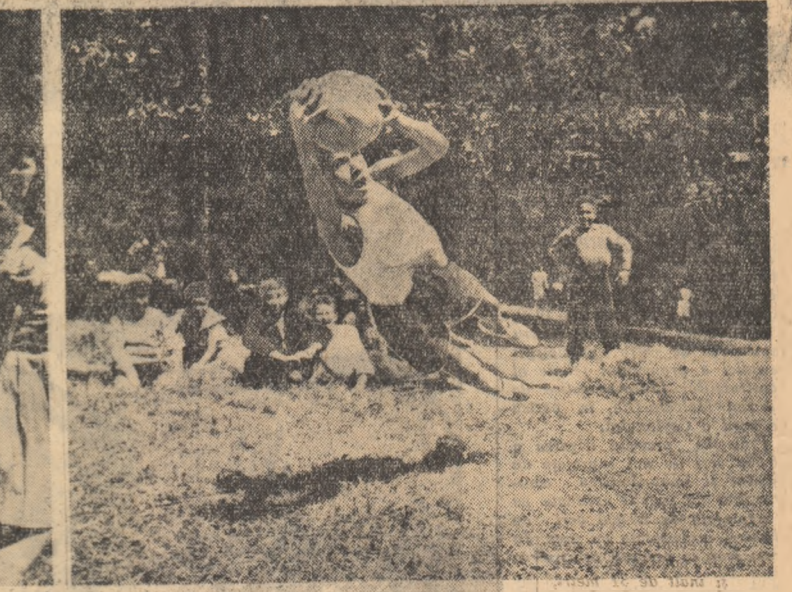
Un planșon spectacolului