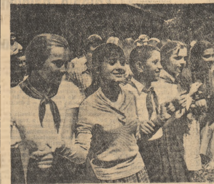
S-a incins hora