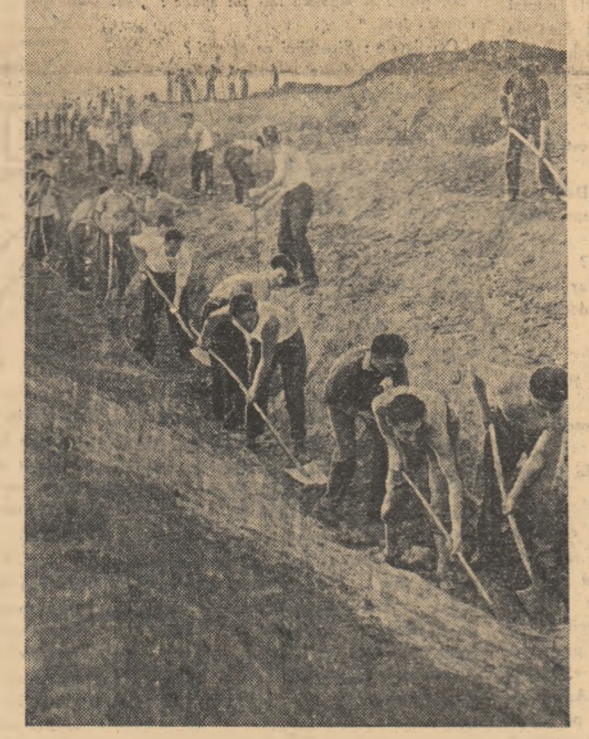
In curând noi suprafețe vor fi irigate și desecate cu pompa de la Otopeni. Tinerii brigadierii al muncii patriotice din întreprinderile și instituțiile Capitalei participă cu însuflețire la lucrările acestui șantier.