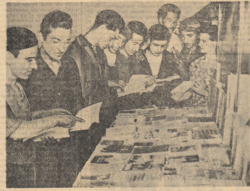
La secția operă și Uzinelor „Electropulere” din Craiova este amenajat un frumos stand de cărți. Numeroși tineri cumpără cărți de aci pentru biblioteca personală.

Ca regizor, spunea HOREA POPESCU întrebarea aceasta mă pune în dificultate. Realizato-