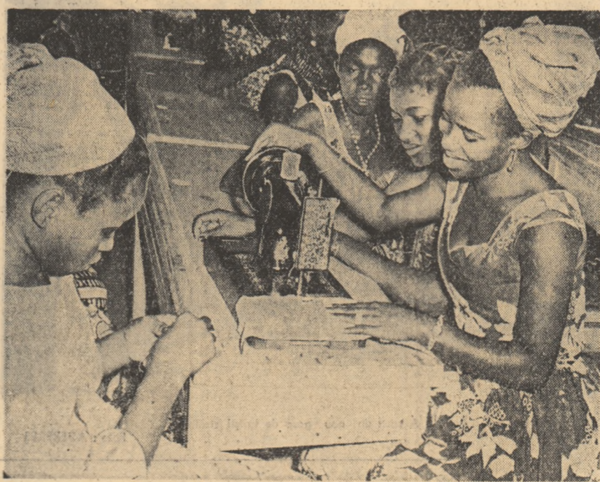
În cadrul organizației de tineret din Guineea, tinerii pot învăța o meserie, în cazul de față croitoria.

riile străine. Guvernele Italiei și ale aliaților ei, se subliniază în notă, se tem nu de prezentele consecințe negative ale unei asemenea atitudini dintr-un punct de vedere al modalităților de desfășurare a dezarmării, ci de faptul că vor să evite însăși dezarmarea. Este intrinsec evident, se spune în notă, că dată fiind o asemenea poziție a puterilor occidentale, activitatea Comitetului celor zece nu numai că a încetat să servească unui țel util, ci, mai mult decît atât, a început să fie dăunătoare, dînd naștere în rîndurile oamenilor din țările care s-au făcut părți la documentul dezarmării, în timp ce în realitate tratativele din comitet erau folosite de membrii N.A.T.O. doar pentru înșelarea popoarelor, pentru camuflarea cursei intensificate a înarmării. După cum subliniază notă, guvernul sovietic este ferm convins că problema dezarmării, de care depind destinele întregii omeniri, trebuie și poate fi rezolvată.