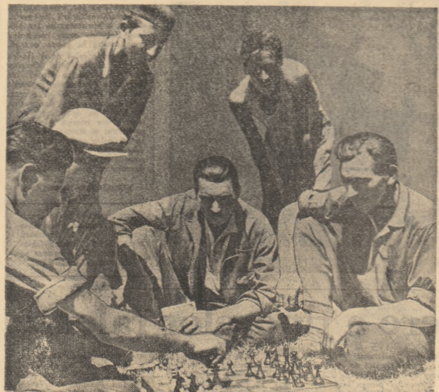
un lucru căruia trebuie să-i acordăm mare atenție în viitor. Mai vreau să învăț pe fiecare tractorist să-și noteze fiecare defecțiune, avuță la mașină în timpul unei campanii agricole. Perioade, vom organiza cursuri în care fiecare tractorist să-și spună părerea de ce a intervenit cîntare sau cîntare defecțiune. Cu să mai mă gîndesc și la alte metode de felul asta. Am să învăț eu și eu să-i ajut și pe ei să învețe. Tehnica nouă, modernă, trebuie cucerită cu eforturi, nu stînd cu minile în pie. Și-ne ce mă privește — a conștientizat șeful de brigadă — n-am să stau de loc în această poziție.

— Cam așa e. Ne-am gândit și la asta. Mai ales în lumina documentelor celui de-al III-lea Congres al partidului, am văzut ce sarcini mari ne stau în față. De aceea, cu ajutorul organizației de partid, al conducerei stațiunii, am să mă străduiesc să fac din fiecare membru al brigăzii mele un maestru în cunoașterea tuturor mașinilor. Cum? La noile cursuri profesionale vor fi prezenți toți, în frunte cu mine. Am de gînd să lupt ca fiecare tractorist să-și facă bibliotecă personală din care cărțile tehnice să nu lipsească, pentru că teoria e un lucru de care nu se putem lipsi cu nici un chip