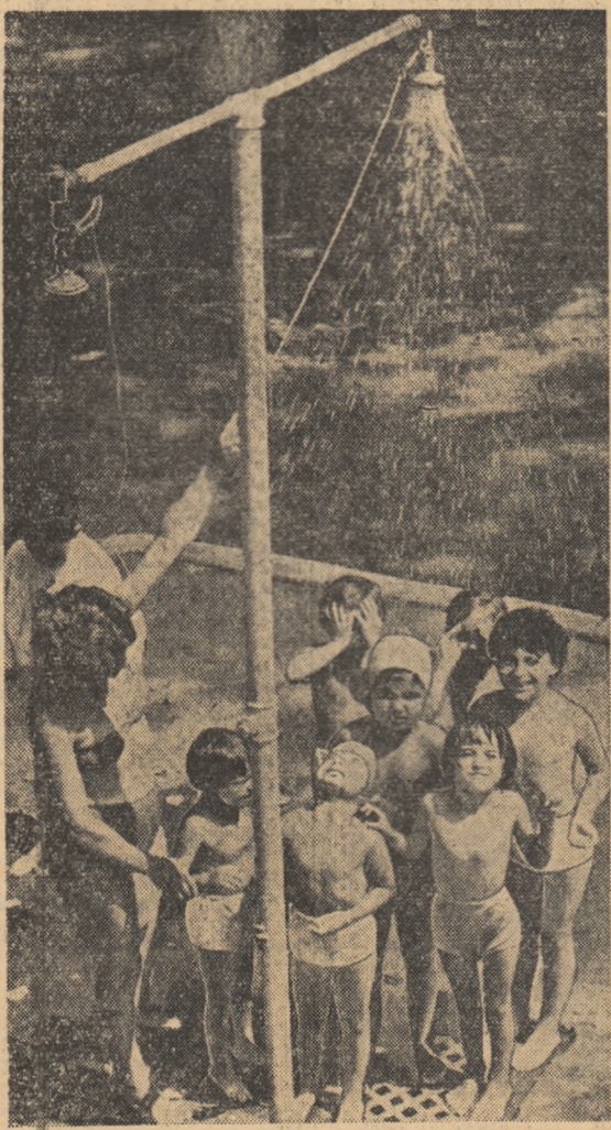
În zilele toride de august, un duș răcoritor este bine venit și pentru cei mici.