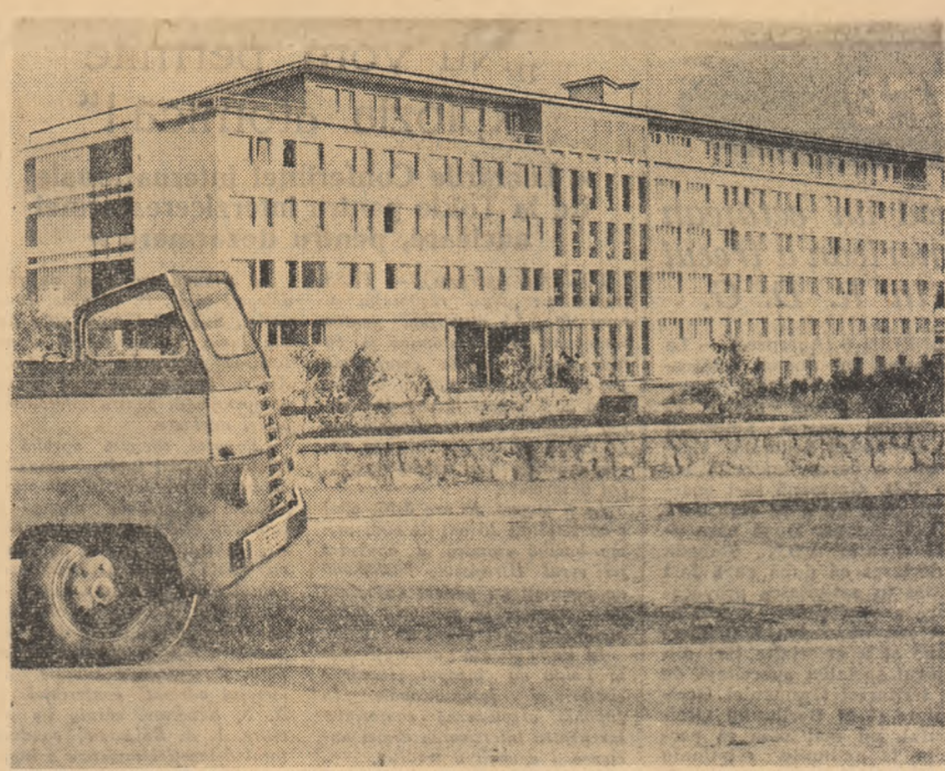
La Mangalia, în vara aceasta, a fost dată în folosinţă o casă sanatorială.