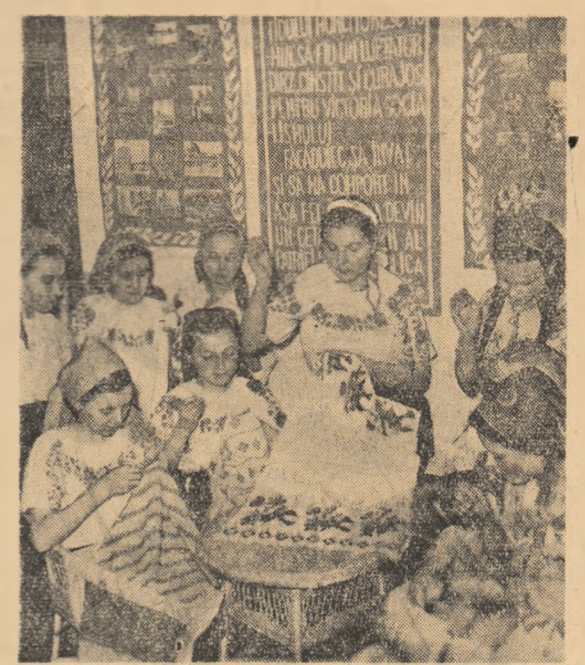
Un aspect de la cercul de cusături al căminului cultural din Poeni, raionul Iași.

Și-o urmat fiecare drumul lui în viață. Visele și povestea viitorului nostru iată-le împlinite și poate puțin rămase în urmă. S-a împlinit așa pentru că așa era prevăzut să se întîmple, pentru că în fond tot ce ne dorăm noi a coincide cu năzuința comună și ferbinte a tuturor constructorilor socialismului care și înscrieseră în planurile muncii și vieții lor un viitor mult mai vast și mai grandios. Și noi am fost cuprinși în planurile acelea. Răspînzînd în marele cloac al prefașelor din țară, oamenii al căror destin urma să sfinșească în mizeria erină a străzii, iată-i ocupînd locul cuvenit în viață, întregi în uraga coloană a constructorilor socialismului. Talente, capacități, valori omenești au fost recuperate și aduse la deplină lor strălucire și utilitate datorită atenției și căldurii cu care s-a aplicat partidul asupra noastră, copii rămași o clipă fără orizont atunci după toate ororile războiului. S-a împlinit ceea ce era firesc să se întîmple în anii și în zilele noastre.