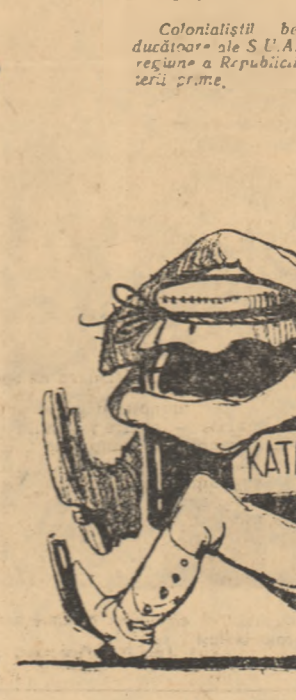
Borcanul cu dulceață. Desen de EUG. TARU