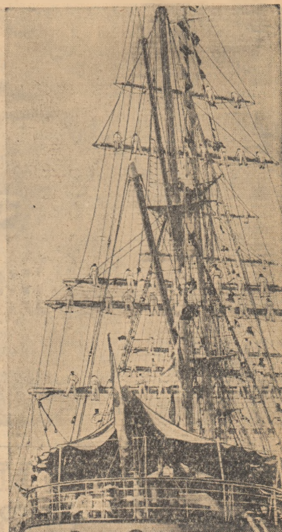
Curajul, bărbăția sînt calități indispensabile marinarilor.

Astăzi, pe toate navele românești se arborează marea pavoa. Pe litoral, în porturile maritime și fluviale au loc frumoase serbări și concursuri nautice. Este Ziua Marinei R.P.R. Sărbătorirea acestei zile este un semn al înaltei prețuiri pe care partidul, guvernul și poporul o acordă muncii pline de abnegație a marinarilor, a muncitorilor și tehnicienilor de pe șantierul naval și din porturi, a apărătorilor apelor teritoriale și litoralului țării. Sărbătorirea de azi are loc în condițiile puternicului avnt politic creat de Congresul al III-lea al P.M.R., eveniment de însemnată istorică în viața partidului și a poporului român. Congresul a făcut bilanțul mărețelor realizări obținute de oamenii muncii în domeniul dezvoltării economice și culturale, în construcția socialistă.