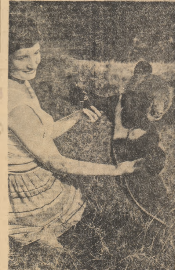
Un urs de Himalaia, născut în grădina zoologică de la Opale (R. P. Polonă)

de alimentare cu benzină și hoteluri. Proiectul prevede și construirea cîtorva poduri mari ca, de pildă podul din apropierea de Hennigsdorff cu o lungime de aproape 700 metri, care va traversa canalul, linii ferate și două șosele.