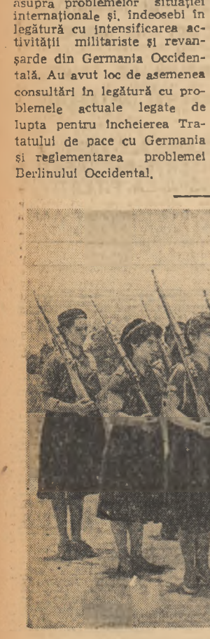
Tinere fete care fac parte din forțele de milite populară din Cuba făcând instrucție lângă orașul Santa Clara.

BERLIN 6 (Agerpres). — La Berlin a fost dat publicității comunicatul cu privire la consultările care au avut loc între 4 și 6 august a.c. la Berlin între Lothar Bolz, ministrul Afacerilor Externe al R.D. Germaniei și Adam Rapacki, ministrul Afacerilor Externe al R.P. Polone. În cursul consultărilor a avut loc un schimb de păreri asupra problemelor situației internaționale și, în special, în legătură cu intensificarea activității militariste și revanșarde din Germania Occidentală. Au avut loc de asemenea consultări în legătură cu problemele actuale legate de lupta pentru încheierea Tratatului de pace cu Germania și reglementarea problemei Berlinului Occidental.