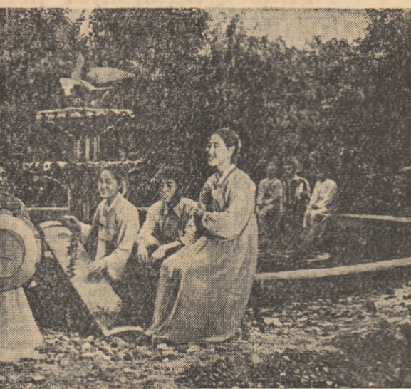
Muncitoarele uzinei de becuri electrice din Phenian se odihnesc în grădina uzinei

statistică ale Ministerului Muncii al S.U.A., „media prețurilor la lunurile de larg consum a ajuns în luna iunie la 126,5 la sută față de anii 1947—1949”. Preziunile unei economii, ceea mai cu picioarele pe pămînt de cit Eisenhower și Nixon, nu sînt deloc optimiste pentru lunile ce urmează în care sînt asteptate noi creșteri ale prețurilor. Poate însă că de pe urma acestor invisibili „șapte ani grași” s-au bucurat învățămîntul, construcțiile, serviciile publice? Arthur Schlesinger jr. afirmă însă că guvernul american nu s-a gândit nici măcar în trecut la îmbunătățirea întămpîntului, asistenței medicale sau la încurajarea culturii. „Avem nevoie de mai multe școli — scrie Schlesinger — de