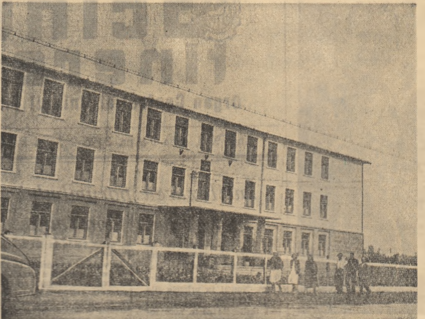
Noua Școală medie din Cîmpia Turzii.

În general există o mare dezordine în ce privește aprovizionarea cu material didactic. Material didactic există dar el este repartizat întâmplător, după înțelegerea unor oameni care nu sînt totdeauna cei mai competenți. La Ministerul Învățământului și Culturii aceste lucruri se cu-