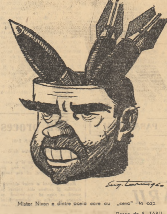
Mister Nixon e dintre ocele care au „ceva” în cap. Desen de E. TARU

Mister Nixon a polemizat recent cu adversarii săi electorali susținând că aceștia „n-au nimic în cap”.