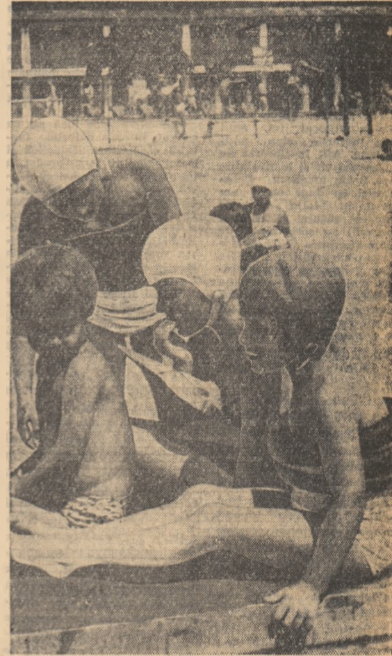
Intra o pauză a lecției de laot.

În regiunea Constanța se desfășoară din plin recoltatul și însilozatul porumbului ajuns în faza de coacere lapteacă. Numai în primele zile de la începerea campaniei au fost însilozate peste 7.000 tone de porumb. Gospodăriile agricole de stat Dorobanțu, Tepeș Vodă, Agiea și altele, precum și colectivizii din Făcăeni, Sudiș și Cobadin, care au aplicat culturile de porumb siloz aceleași lucrări de întreținere ca și porumbul pentru boabe, au realizat de pe primele suprafețe recoltate producții între 22.000 și 30.000 kg masă verde în medie la hectar.