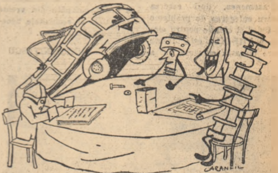
La masa rotundă a produselor, discuții imaginare despre probleme reale

Arborele-motor tăcu o pauză, sorbi pe îndelete o cană întreagă