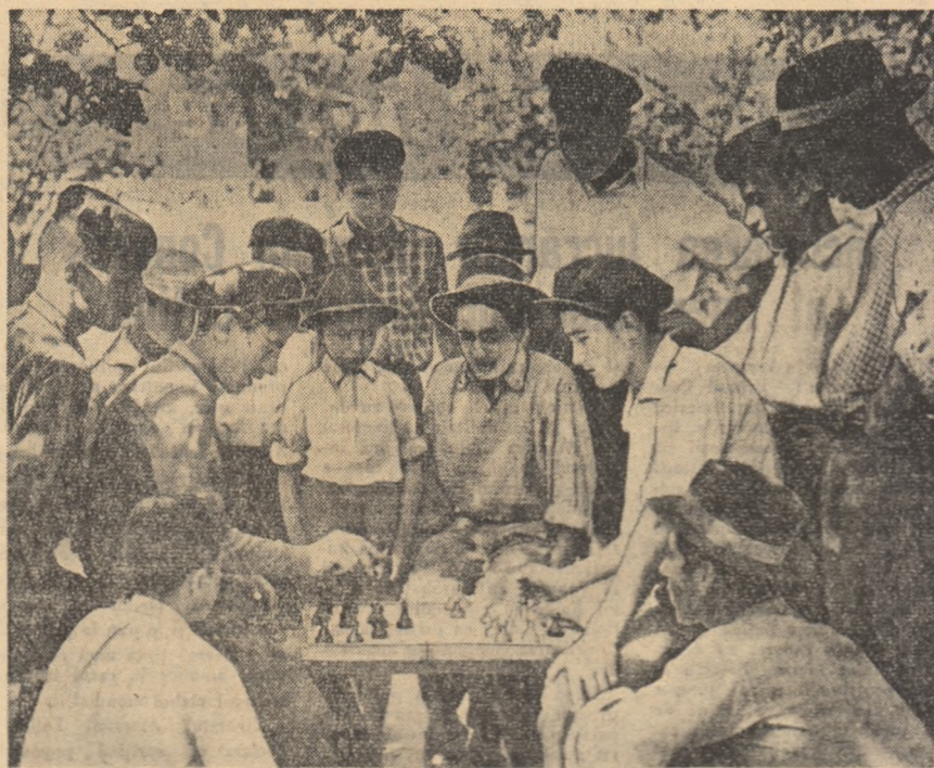
În clipe de răgaz, o partidă de șah îi pasionează pe tinerii colectivității din comuna Ștefan Vodă din raionul Călărași.

„ȘARJA PĂCII” — Muncitorii de la secția de turnătorie al Complexului „Grivița Roșie” au dat zilele acestea, pe plan, o „sarjă a păcii”. Metalul pentru această sarjă a păcii a fost colectat chiar de muncitorii de la turnătorie. În special de membrii brigăzilor de tineret. (Agerpres)