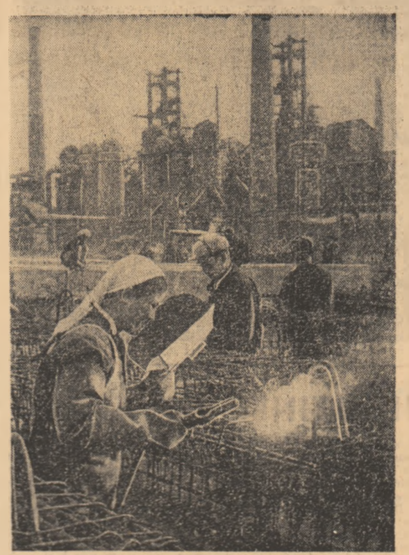
Pe șantierul celei mai mari întreprinderi siderurgice din R.P.D. Coreeană: uzina „Kim Cick”