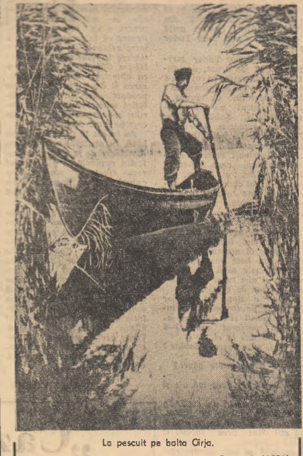
La pescuit pe balta Grja.

La Galeria Națională de Tablouri din Erivan s-a deschis o expoziție a creațiilor remarcabile ale pictorilor armeni din secolul al XIX-lea — Akop și Aghvan Orntasianca. În istoria culturii armenice sînt remarcate șase generații de pictori din familia Orntasianca, care au creat în decurs de aproximativ două secole (din secolul XVII pînă în secolul XIX). Studiarea aprofundată a creației familiei Orntasianca s-a efectuat abia în anii pînă la revoluția sovietică. În ultimii ani au fost descoperite peste 50 de portrete aparținînd acestor pictori, precum și picturi murale în catedrală și biserică, tablouri pe teme religioase.