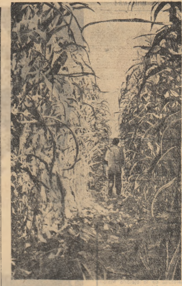
La sovhozul „Balant nr. 1” de pe pîmînturile desțelenite din fosta „Stepă flîmîndă” (regiunea Tașkent) a fost obținut un soi de porumb ușiș. În fotografie: unul din lanurile de porumb de pe care se obține o recoltă de cel puțin 800 chintale masă verde.

Eminescu a intuit în Creangă nu numai un savuros povestitor, dar și un scriitor exigent cu sine, capabil să dea realității sale, într-un limbaj de o neașteptată culoare stilistică, a expresiei artistice strălucite. Din îndemnul lui Eminescu, Creangă scria povestile „Socră cu trei năruri” și „Capra cu trei iezi”, autentice scene de gen din viața satului nostru, ambele a-părute către sfîrșitul anului 1875. Stimulat de prietenul său, Creangă scria convins, cu un deznăscut simț de răspundere pentru cuvîntul tipărit. Creangă, scrie G. Călinescu, „era mîncat de sentimentul răspunderii și se umplea de toate sudorile care se apuca să compună ceva. De obicei se scula în zorii zilei, de la 4 dimineața și se apleca la lucru. Scria cu condeiul de plumb pe tot felul de petece ori pe coale întregi, ștergea, trimitea cu semne în altă parte și nu suferă pe nimeni lîngă sine...”