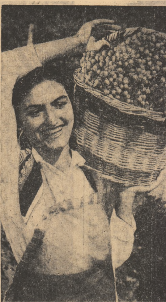
La G.A.S. Valea Călugărească a început culesul strugurilor de masă.

Pentru a parveni și pentru a-și satisface pofurile individualiste, morale, Mihail Nistor a încercat să îndepărteze din calea sa pe oamenii cinstiți care-l stînjeau, a calomniat și nedreptățit tovarășii ca carea unei părți din utilaj, acuzîndu-i unor muncitori, și, în ultimă instanță, compromițînd în întrecere, frînarea aplicării tehnicii noi în uzină, im-