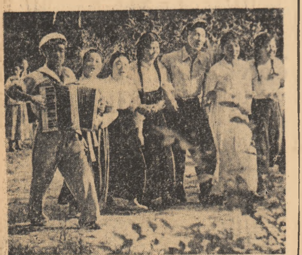
Parcurile din Phenian constituie locuri minunate de recreere pentru tineret.

Cu prilejul marilor sărbători a Coreei populare — cea de a 15-a aniversare a eliberării sale — adresăm poporului, tineretului frate coreean un fierbinte salut, și le urăm noi succese pe drumul luminos al socialismului, în lupta pentru unificarea pașnică și democratică a patriei sale și a apărării păcii în întreaga lume.