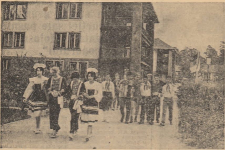
Un aspect de la Tabla internațională de vară pentru copii de la Werbellinsee (R.D.G.).