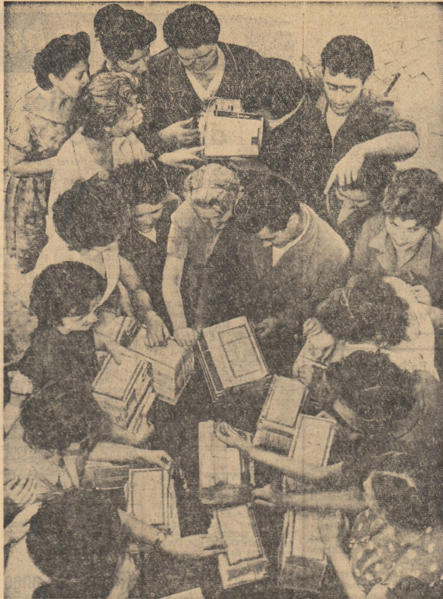
Au sosit cărţi noi. Tinerii de la Întreprinderea „Electronică” din Capitală se grăbesc să-şi cumpere cărţi pentru biblioteca personală.

După adunarea festivă a avut loc un program artistic prezentat de Ansamblul de cîntec şi dansuri al Sfatului Popular al Capitalei, şi soliştii ai Teatrului de Operă şi Balet din Capitală.