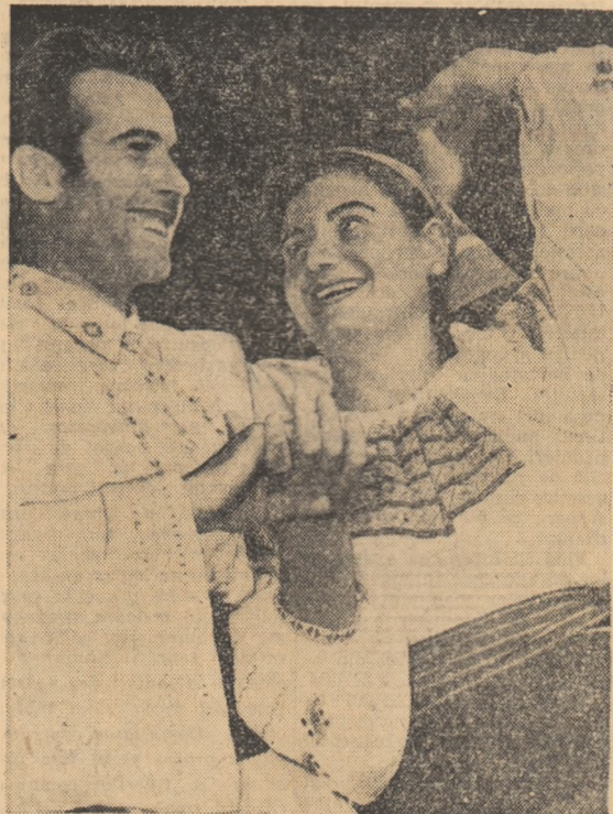
În împlinirea zilei de 23 August tinerii artiști amatori de la Casa de cultură raională din Murgeni, regiunea Iași, pregătesc un nou și bogat program artistic.