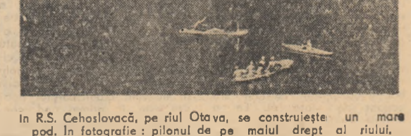
In R.S. Cehoslovacă, pe rîul Otava, se construiește un mare pod. In fotografie: pilonul de pe malul drept al rîului.

Acrobațiile avocaților Pentagonului și ai agenției centrale de spionaj sînt deosebit de curioase. Mi se permite să se abate atenția americanilor de la gravitatea acuzațiilor pe care opinia publică mondială le va arunca fără îndoială in fața provocărilor americani. Străduință zadarnică. Spionul va fi cu siguranță pedepsit. Dar condamnarea va fi pronunțată nu numai și nu altă împotriva lui, cît împotriva sistemului care l-a trimis pe acest pilot spion in spațiul aerian al U.R.S.S.