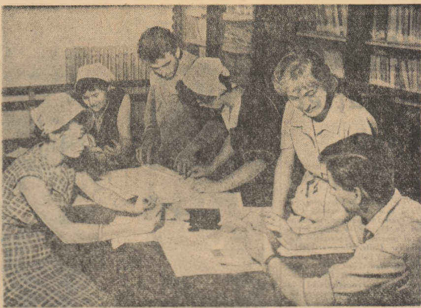
La cabinetul tehnic de la Intreprinderea „Teșătorile Române” din Capitala muncitorilor sînt în discuție diferite materiale pentru ași ridică nivelul cunoștințelor tehnico-profesionale.