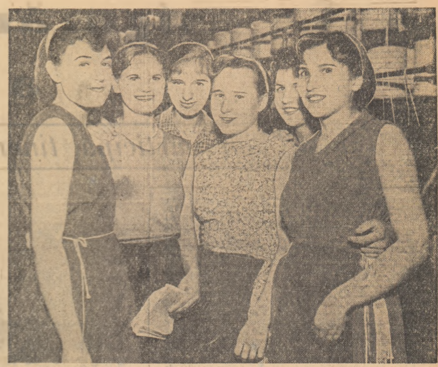
Iată în fotografia noastră pe membrele brigăzii de tineret „I. Moș”, de la Întreprinderea „Industria Lănel” Timișoara. Organizația și mai bine munca, aceste tineri au reușit ca pe ultima lună să îndeplinească planul în proporție de 112,9 la sută.