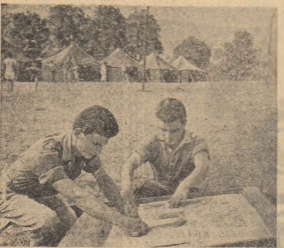
În timp ce unii fac sport, „reporterii” pregătesc noul număr al gazetei de perete, care cuprinde, fără îndoială, multe fapte interesante din viața taberei.