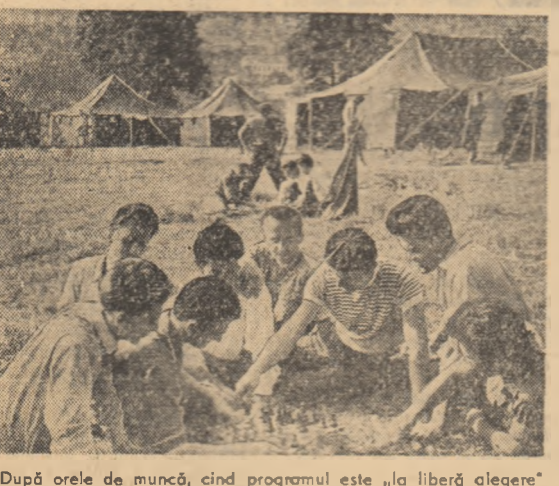
După orele de muncă, când programul este „la liberă alegere” fiecare își găsește o preocupare preferată. Iată, cițiva s-au antrenat într-o pasionantă partidă de șah.