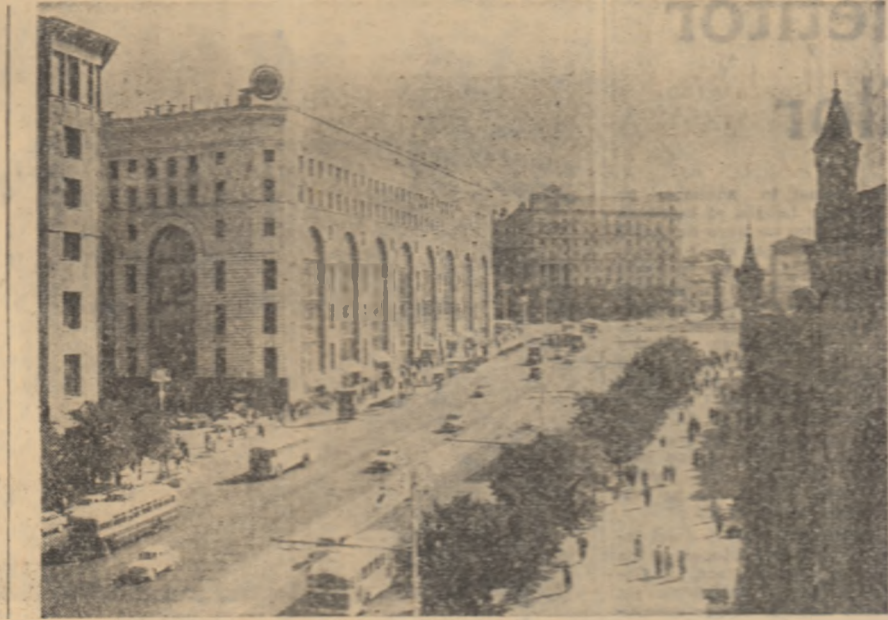
Pe una din animatoarele străzi ale Moscovei, capitolul glorioasei Uniunii Sovietice.

Acordarea independenței Ciprului este fără îndoială o cîștig importantă in lupta poporului cipriot pentru libertate, înă mîntinerea bazele mîntinere strîngă pe insulă prîbește decăderea cipriozilor, iar o serie de probleme de importanță vitală pentru ei nu și-au găsit încă o rezolvare favorabilă.