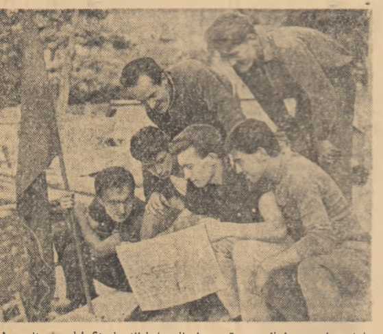
A sosit ziarul! Studenții-brigadierii urmăresc zilnic evenimentele interne și internaționale.