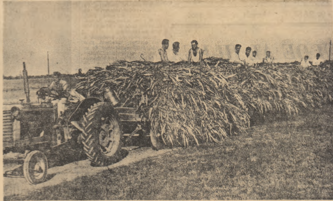
„Trenuri” cu porumb-siloz de la G.A.S. Pantelimon-București.

Din această bogăție nu trebuie să se piardă niciun kilogram.