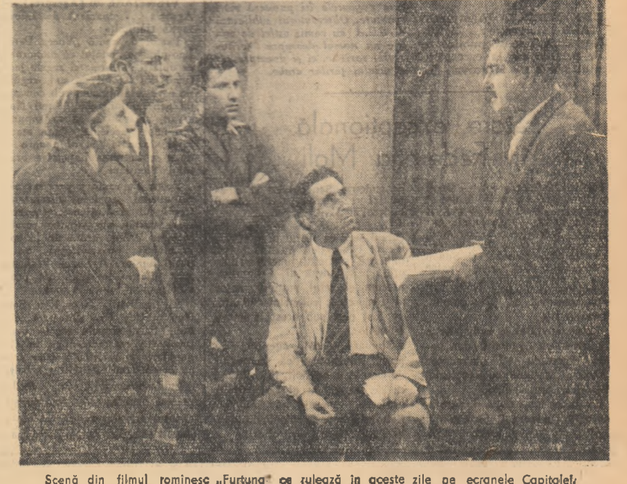
Scenă din filmul românesc „Furtună” ce rulează în aceste zile pe ecranele Capitalei.

În cinstea zilei de 23 August, în orașul Cluj a fost dat în folosință sîmbătă noua sală de sporturilor cu o capacitate de aproximativ 2000 de locuri. Această bază sportivă este dotată cu tot aparatul necesar, vestiare, săli de antrenament, dușuri, depozite pentru echipamentul sportiv. Noua sală a sporturilor ridicată în apropierea Parcului sportiv al Universității „Babeș-Bolyai” va putea fi folosită pentru desfășurarea competițiilor de