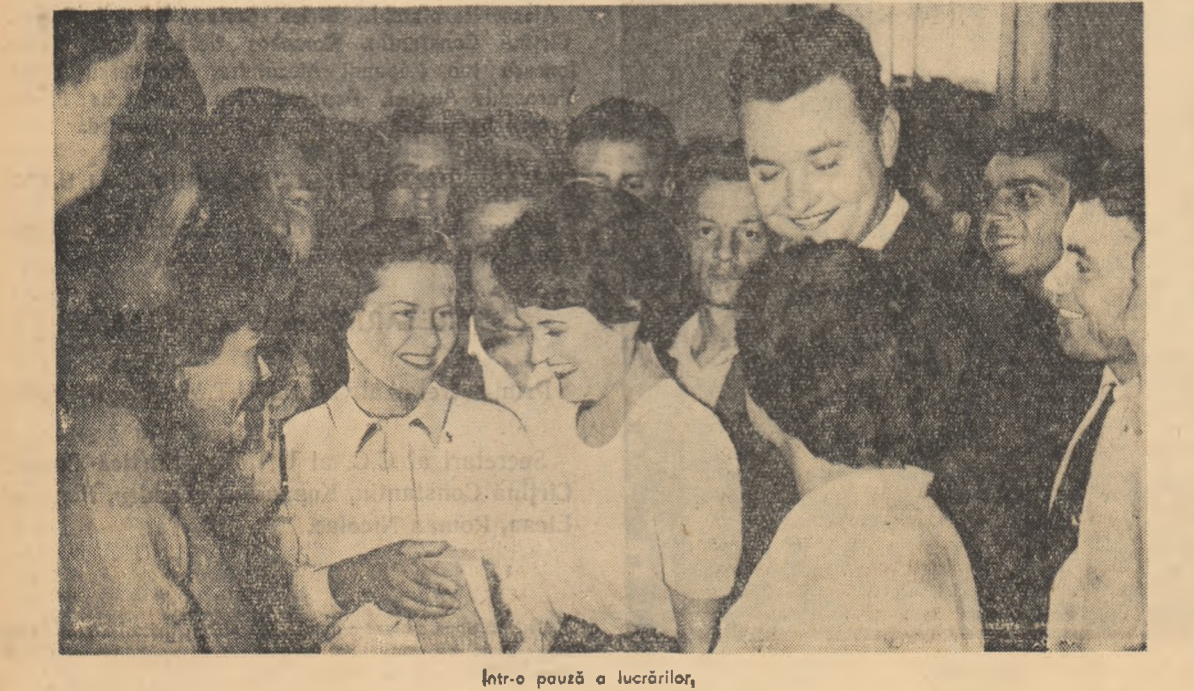
Într-o pauză a lucrărilor.

neretului Muncii din Vietnam adresată celui de-al III-lea Congres al Uniunii Tineretului Muncitor din România. În scrisoare se spune, printre altele: „În numele celor 710.000 de membri ai Uniunii Tineretului Muncii din Vietnam și al tuturor tinerilor vietnamezi, sîntem fericiți să adresăm salutul nostru frățesc celui de-al III-lea Congres al Uniunii Tineretului Muncitor din Republica Populară Romînă. Tineretul din Vietnam a urmărit întotdeauna cu simpatie profundă marile înfruptări ale poporului și tineretului român în opera de construire a socialismului în România, sub conducerea Partidului Muncitoresc Român. Succesele voastre, dragi tovarăși, care au ca rezultat ridicarea nivelului economic și cultural al poporului român contribuie în același timp și la înfruntarea lagărului socialist, în fruntea căruia se află Uniunea Sovietică, precum și la menținerea păcii în Europa și în lumea întreagă. Încheiere vorbitorul a oferit în dar Congresului un drapel al Uniunii Tineretului Muncii din Vietnam.