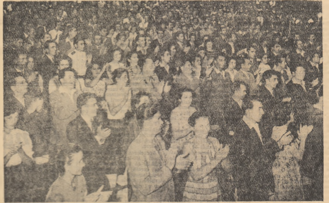
Un aspect din sala Congresului.

cursul anului 1960 un număr de peste 2.100 dintre cei mai buni utemiști care să se ocupe cu grijă de creșterea și îngrijirea animalelor. Aceștia muncind cu dragoste pentru dezvoltarea sectorului zootehnic au obținut rezultate frumoase în sprirea producției de carne și lapte. În unele organizații de bază U.T.M. însă, preocuparea pentru sprijinirea dezvoltării sectorului zootehnic se consideră terminată odată cu recomandarea acestora pentru munca de creștere de animale. Unele organizații U.T.M. nu-i ajută suficient pe tineri în vederea formării lor ca buni crescători de animale. În baza experienței dobîndite în anul trecut, considerăm că este bine ca organele de resort să studieze posibilitățile trimiterii în perioada de iarnă a unui număr de tineri din G.A.C. pentru a fi pregătiți în G.A.S. cu sector zootehnic dezvoltat. Organizația regională U.T.M. Iași, sub conducerea organizației regionale de partid, se angajează să lupte pe viitor cu toată perseverența pentru mobilizarea și mai activă a tineretului la îndeplinirea mărețelor obiective ce ne stau în față.