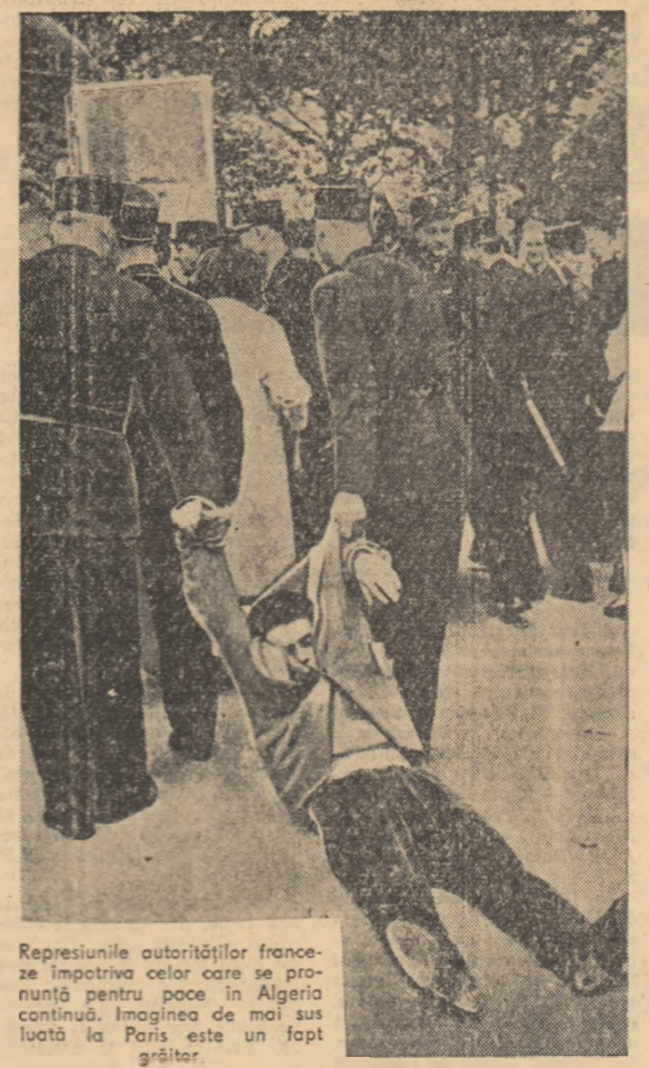
Reprezentanții autorităților franceze împotriva celor care se pronunță pentru pace în Algeria continuă. Imaginea de mai sus luată la Paris este un fapt grîtor.

Simlăbă seara agențiile de presă transmiteau că generalul de Gaultie, a adresat, în calitate de președinte al Comunității franceze, mesaje lui Modibo Keita și Mamadou Dia invitîndu-l la Paris pentru consultări.