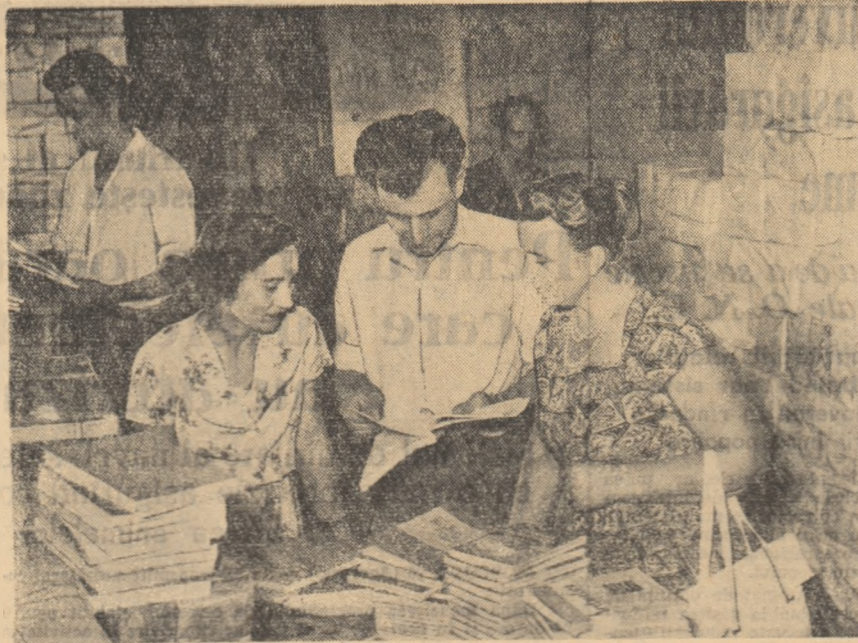
La depozitul de cărți școlare din B-dul Gh. Coșbuc nr. 36-40 din Capitală a început distribuția manualelor pentru școlile elementare de 7 ani care în anul școlar 1960-1961 vor fi distribuite gratuit elevilor. De aici vor pleca spre școlile din regiunea și orașul București 350.000 manuale școlare. Numai în prima zi s-au distribuit pentru școlile din raionul Grivița Roșie 11.000 manuale școlare.

nistrul, membri ai Prezidiului Marii Adunări Naționale, conducători ai organizațiilor obștești, delegați și invitați la Congres. Au luat parte reprezentanții organizațiilor de tineret de peste hotare care au participat la lucrările Congresului. Masa tovarășească s-a desfășurat într-o atmosferă de caldă prietenie și entuziasm tineresc.