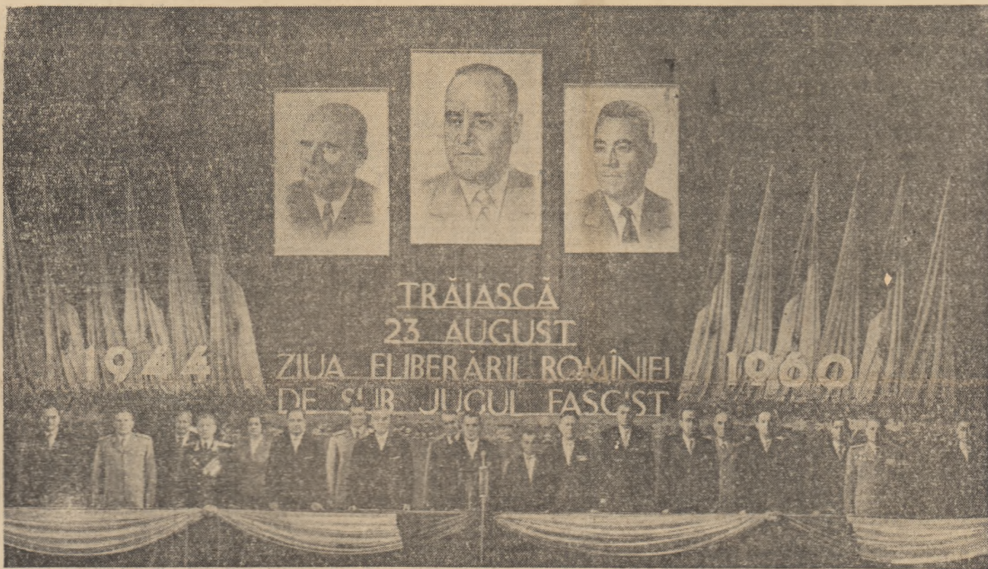
Prezidiul adunării festive organizate în cinstea celei de-a 16-a aniversări a eliberării României de sub jugul fascist.