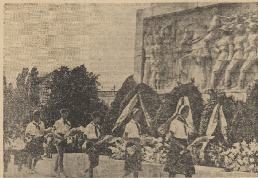
Pionierii depun buchete de flori la Monumentul Eroilor Sovietici.