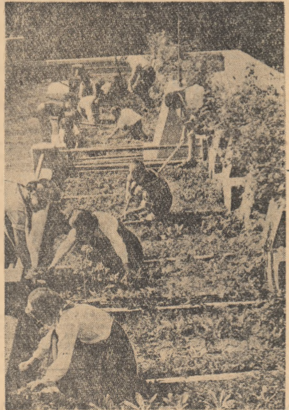
Pionierii ai Școlii de 7 ani din Telega-Cîmpina Ingrîșind mormintele eroilor clasei muncitoare din cîmîntul „Treii prun”!

Iată ce căi noi și largi se deschid în fața tinerilor din întreaga țară. Și alte mijloace stau la îndemîna organizațiilor U.T.M. în aplicarea mai creatoare, mai inventivă, mai aproape de tineri, a inițiativei de la Vladimiri. Mișcînd pentru cunoașterea evenimentelor principale din viața colectivului (lupta antifascistă, reforma agrară, naționalizarea etc.) evocînd chipul luptătorilor la locul în care au muncit ei cîndva, acolo unde se păstrează ceva din amintirea lor, vom descifra greul trecutului, pentru că să înțelegem și îi bine chemarea anilor ce vin. Nimic din tot ce a fost frumos, eroic, mîreț și demn, să nu se înșească.