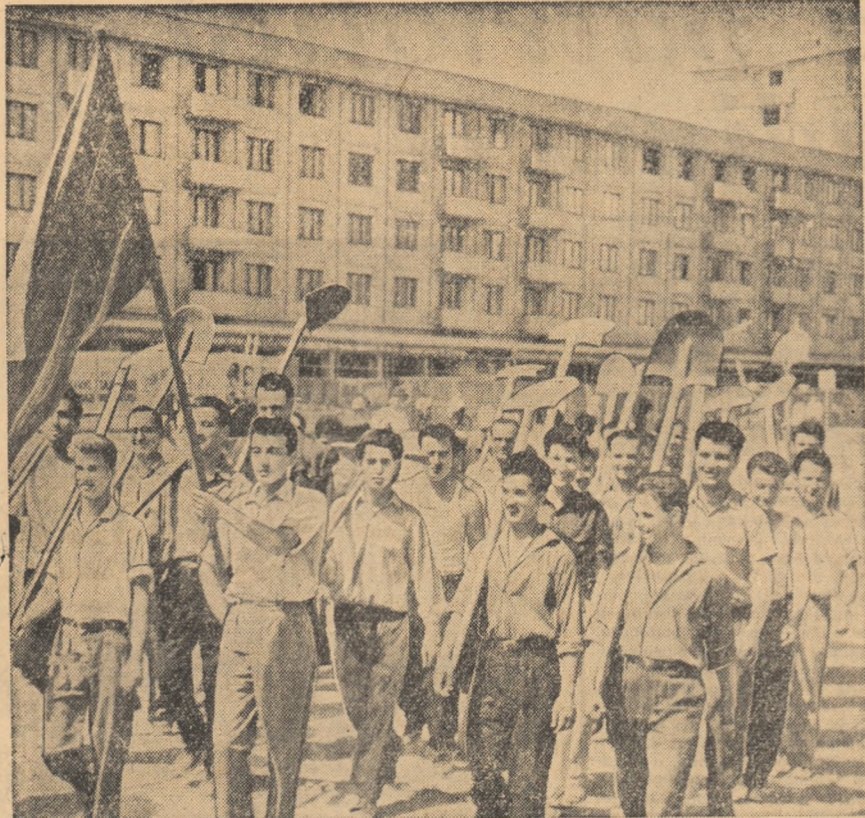
În timpul vacanței studenții clujeni participă cu însuflețire la acțiunile patriotice. Iată în fotografie un grup de studenți clujeni alături de o brigadă utemistă de muncă patriotică îndreptându-se spre unul din obiectivele de muncă de pe șantierea Complexului studențesc care se construiește în oraș.

Să extindem Inițiativa patriotică a tinerilor din Vladimir!