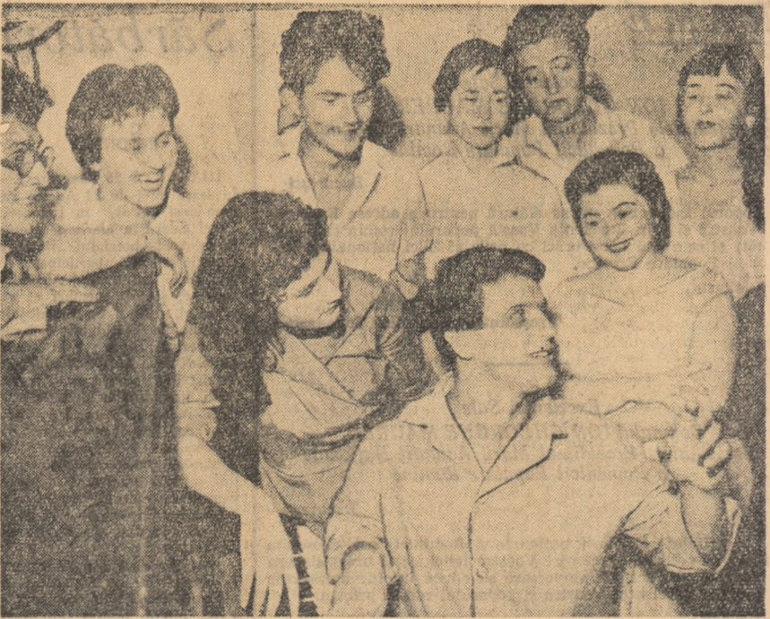
Brigada artistică de agitație a Casei de cultură a tineretului din raionul Nicolae Bălcescu a fost surprinsă de foto-reporter în timpul unei repetiții la noul spectacol „16 ani de viață nouă“.