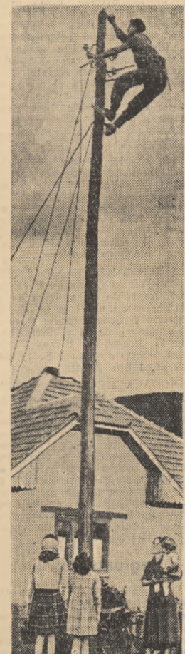
În tot mai multe case din Volea Borceului, pîtrunde lumina electrică.

Atîrta de vîrstnici, tinerii urgiști de la Hunedoara au dat peste de la 1 ianuarie pînă 5 august, 36.431 tone de l. La Jurnalul tineretului a Uzinele Victoria din Iași, prin ridicarea temperaturii aerului însoțit în 1 și mărirea intensității redere, consumul de coals timelo 4 luni a fost re-