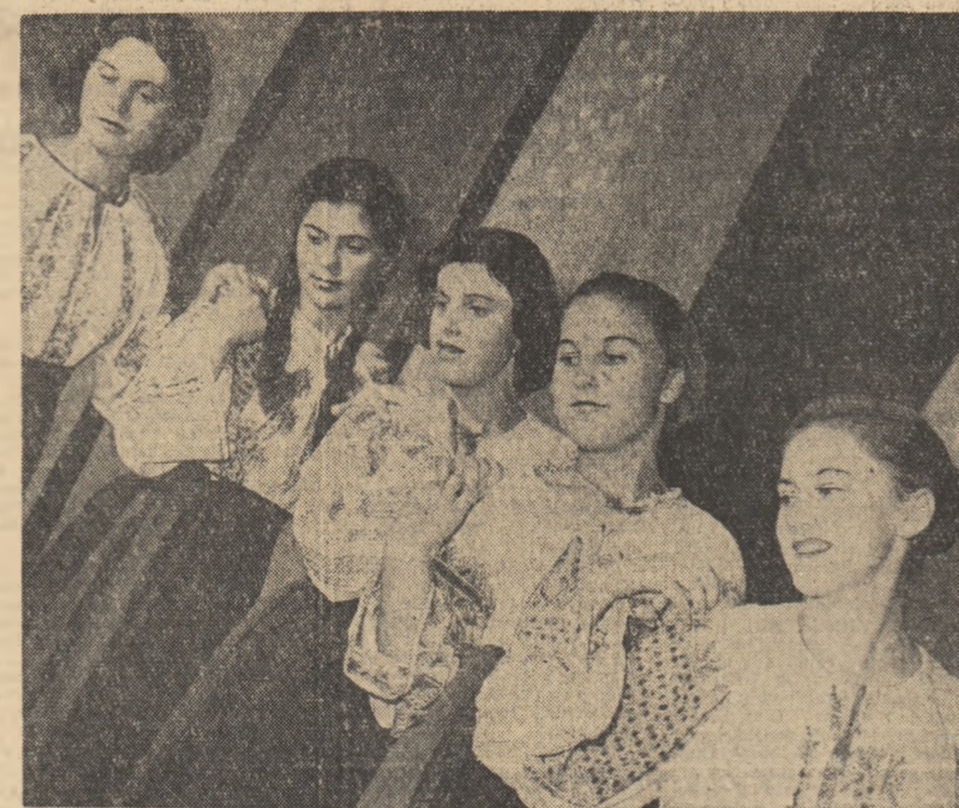
La Casa de cultură din Baia Mare se desfășoară o viață activă cultural-artistică. Echipa de dansuri a O.C.L. Industrial pregătește un nou dans

ceastă problemă am discutat-o de asemenea în colectiv. Unii tovarăși erau de părere să ilustrăm lipsurile constatate printr-o caricatură. Alții, că ar fi mai bine ca la gazeta „Vorbeste postul utemist de control” să apară o epigramă în cele din urmă s-a stabilit să publicăm un material satiric, bine documentat, în care să explicăm situația, să arătăm daunele materiale pe care le aduce neglijența, cum