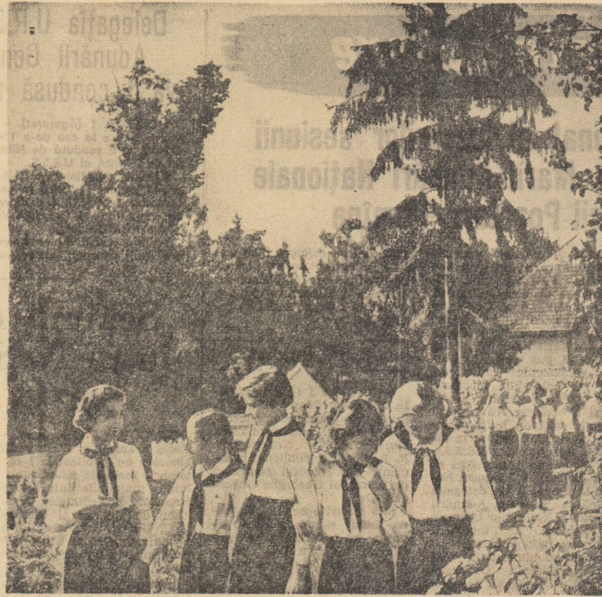
Zile de vacanță în tabăra pionierilor de la Sighișoara.