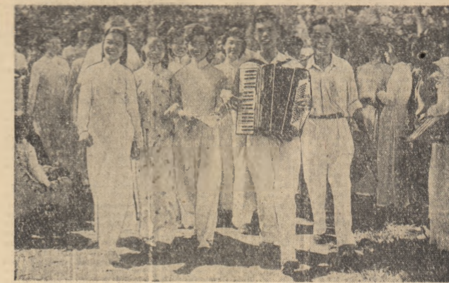
Bucurie, entuziasm, prospețime, fericire, lată ce oglindește chipurile acestor tineri care petrec clipe plăcute într-unul din parcurile orașului Hanoi, Capitala Republicii Democratice Vietnam.

„Sînt fericit, scrie Gürsel, că instaurarea noului regim din Turcia a fost primită favorabil la Moscova. Pot să vă reafirm că și în domeniul relațiilor internaționale guvernul meu se va călăuzi după principiile lui Atatürk”.