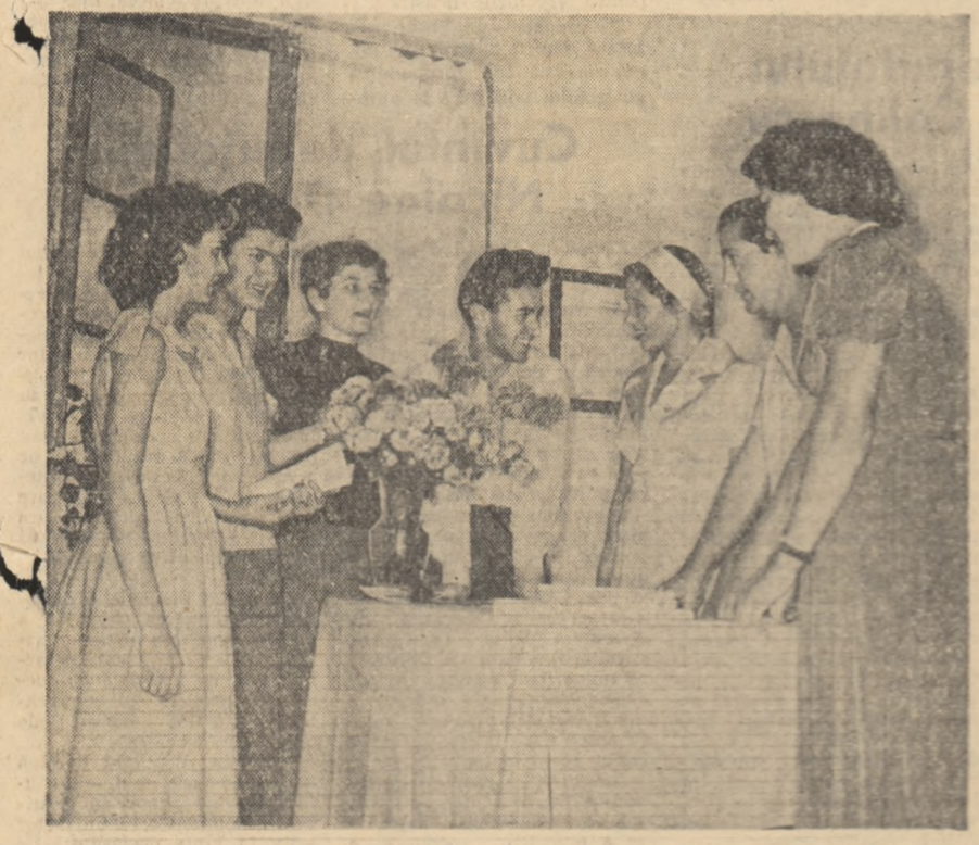
Din nou la școală. Cîțiva elevi din clasa a VIII-a a Școlii medii serale de pe lângă Combinatul poligrafic „Casa Științei” discutînd veselii cu profesora lor.