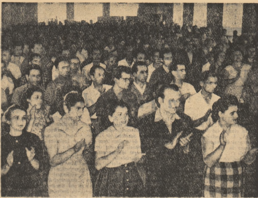
În sala de festivități a Fabricii „Kirov” din Capitală