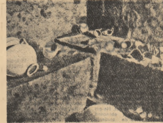
Această fotografie a unui mormînt etrusc a fost făcută cu sonda fotografică fără să se sape nici o oază de pămînt. În acest mormînt de 3.000

Metodele arheologice aerie- ne s-au dovedit deosebit de