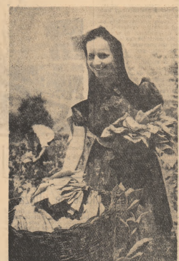
Recoltatul tutunului la cooperativa agricolă din Llovin, raio- nul Argyrocastro (R.P. Albania).