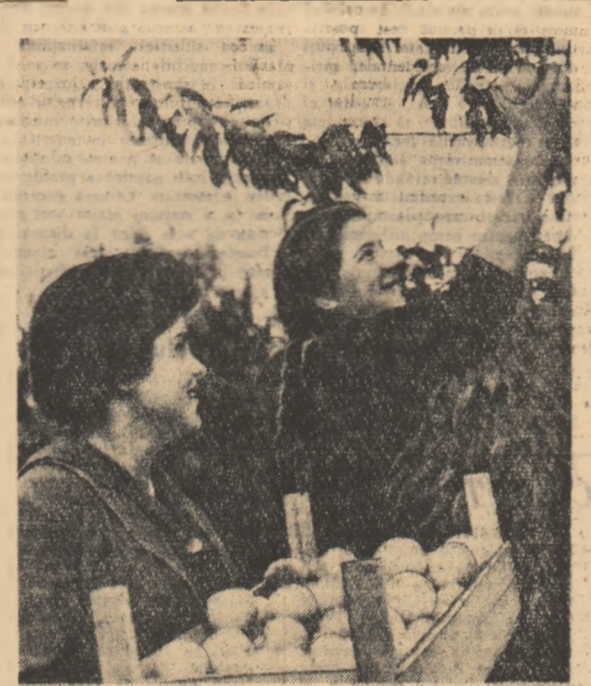
La culesul piersicilor în G.A.S. Neudorf, regiunea Timișoara

Munca în producție, sub forma practicii sau a muncii patriotice exercită un important rol educativ și instructiv. De asta se conving, tot mai mult, studenții înșiși. Contactul di-