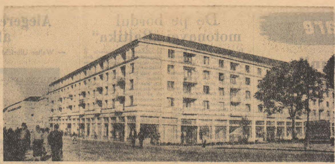
Construcții noi, date recent în folosință la Craiova.