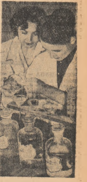
În laboratorul Fabricii de Ciment din Bicoz se face analiza chimică a materiei prime.

practică a metodelor bune, a experienței organizațiilor care au avut greutăți asemănătoare și le-au rezolvat. În oraș sînt unele organizații U.T.M. care au reușit să antre-neze un mare număr de tineri în acțiunea de ridicare a calificării țiereturilor și au obținut succese pe această linie. Despre ce experiență este vorba? La întreprin-derea „Electromotor”, de pildă, organizația U.T.M. a antrenat numeroși ingineri să ajute tinerii muncitori să se descureze mai bine la cursurile organizate pentru ridicarea calificării, să realizeze un contact cît mai fo-lositor cu cartea tehnică. La orga-nizarea propriu-zisă a forme-lor de ridicare a calificării, orga-