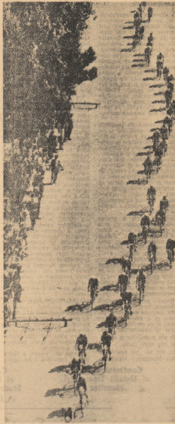
Prima etapă a Turului ciclist al R.P.R. pe anul 1960 a avut bucurăștii un spectacol entuziast.