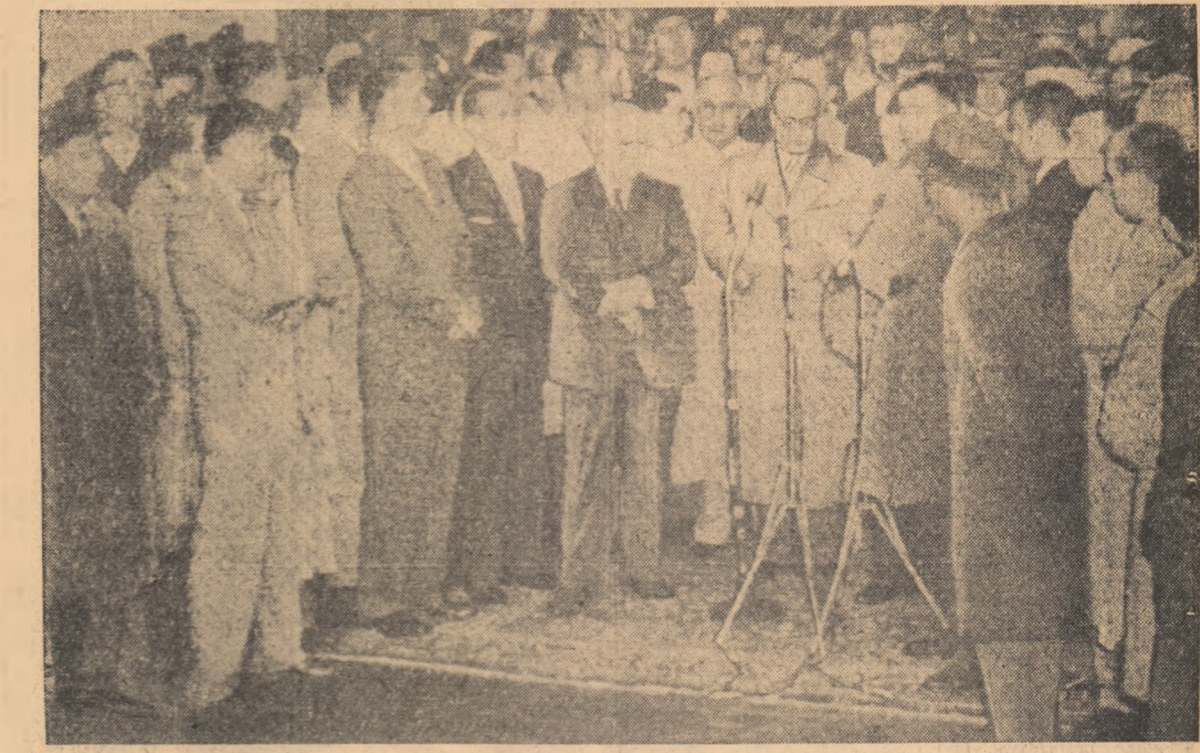
Sosirea la New York. Tovarășul Gh. Gheorghiu-Dej roștindu-și cuvîntarea