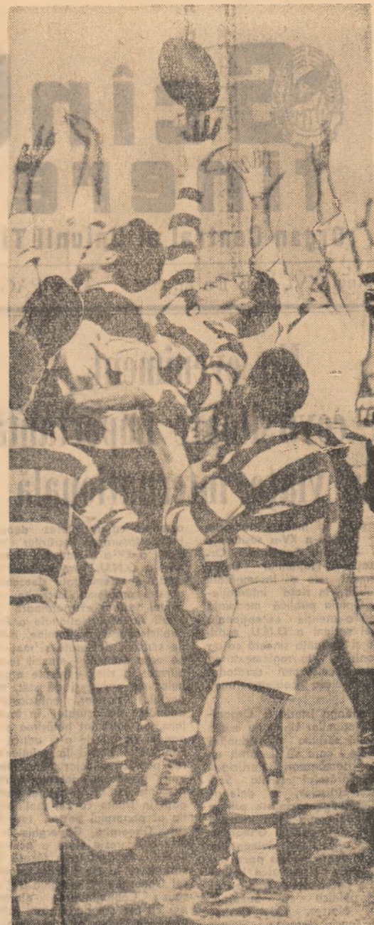
Balonul oval a fost repus în joc prin clasică tușă. Fază din întîlnirea internațională de rugbi Știința București—A.Z.S. Varșovia (19-3).

P. BRĂTAN correspondent „Științei tineretului” pentru regiunea Stalin