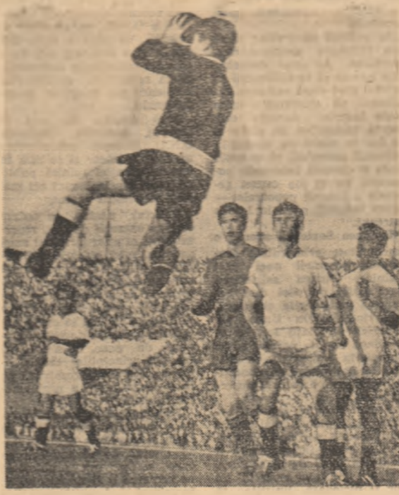
Dungu uimeste cu această spectaculoasă intervenție pînă și pe coechipierii săi (fază din meciul Rapid—C.C.A.).