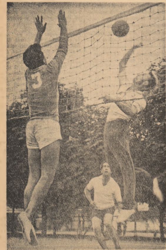
Voleibaliștii de la F.R.B. încearcă un nou atac în partida susținută în compania sportivilor de la „Teșătorile Reunite” disputată în cadrul întrecerilor finale pe Capitală ale Concursului cultural sportiv al tineretului.

sportiv, a trecut atîta timp fără ca organizațiile U.T.M. și asociațiile sportive să se preocupe de antrenarea în continuare a masei largi de tineri la practicarea sportului. Pasivitatea în care se complac cei ce sînt chemați să organizeze activitatea sportivă a tineretului face ca aceasta să bată pasul pe loc. Și-i explicabil, de vreme ce după etapa I, a unei competiții sportive de masă, tinerii sportivi intră în vacanță. Activitatea sportivă de masă a tineretului poate avea continuitate numai dacă este organizată pe baza unui calendar sportiv local al asociației. O serie de competiții locale cum sînt cele pentru cucerirea însignei de „Cel mai bun sportiv din 10” sau „Insigna de campion al asociației”, întreceri inter-ateliere sau inter-comunale se pot organiza fără prea mari cheltuieli și se bucură de o mare popularitate în rândurile tineretului. Dar în cele mai multe din asociațiile sportive ale raionului Făgăraș lipsesc aceste calendare și deci lipsesc și activitatea. Se pune în mod firesc întrebarea: cum au sprijinit organizațiile U.T.M., comitetul raional U.C.F.S. pe cei ce conduc asociațiile sportive, Consiliul ra-