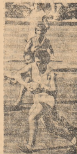
Un atac al formației feminine de handbal redus „Știința”. Mișcarea care a dispus duminică de Progresul București cu scorul 9-7.