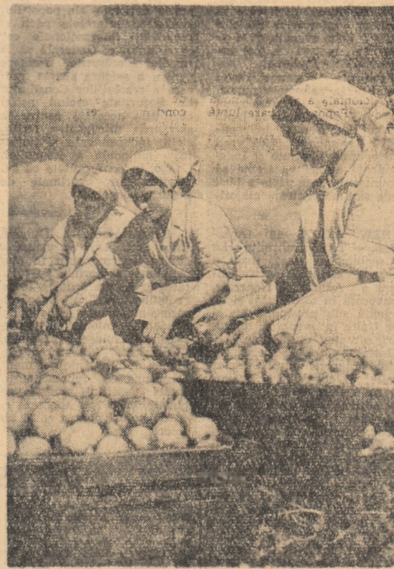
Fabrica de conserve „Burdujeni” Suceava produce dulceleuri, gemuri, sîropuri, marmeladă și un bogat sortiment de conserve din legume. Muncitorii și inginerii fabricii au realizat planul pe luna august în proporție de 107,6 la sută dînd produse de bună calitate. În foto: sortarea merelor pentru marmeladă la secția Fălticeni a fabricii de conserve a fructelor și legumelor din Burdujeni.