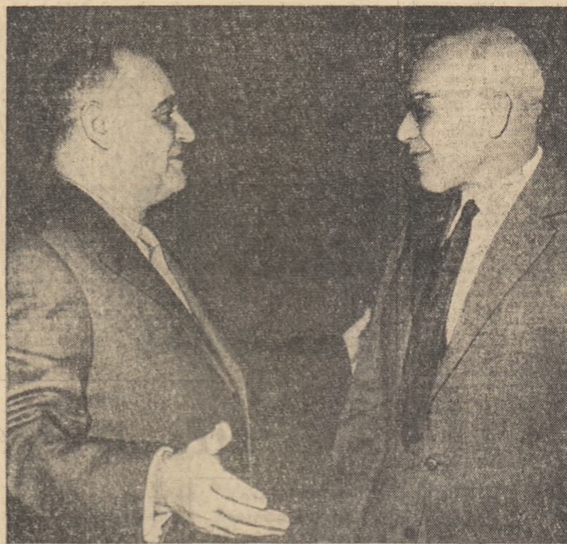
Tovarășii Gheorghe Gheorghiu-Dej și Wladyslaw Gomulka discutînd într-o pauză a lucrărilor sesiunii O.N.U.