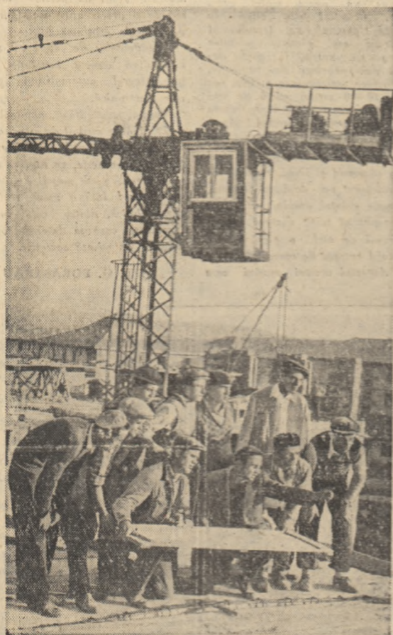
lată în fotografia noastră pe Inginerul Bărbai Ioan, șeful lotului nr. 2 din șantierul 3 Construcții-Onești, discutând împreună cu brigada de zidari condusă de Dumitru Novîțki planul unei zile de muncă.