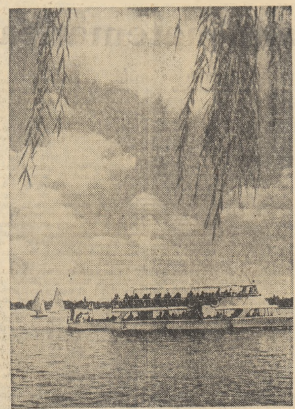
Cu hidrobulul pe lacul Herăstrău.