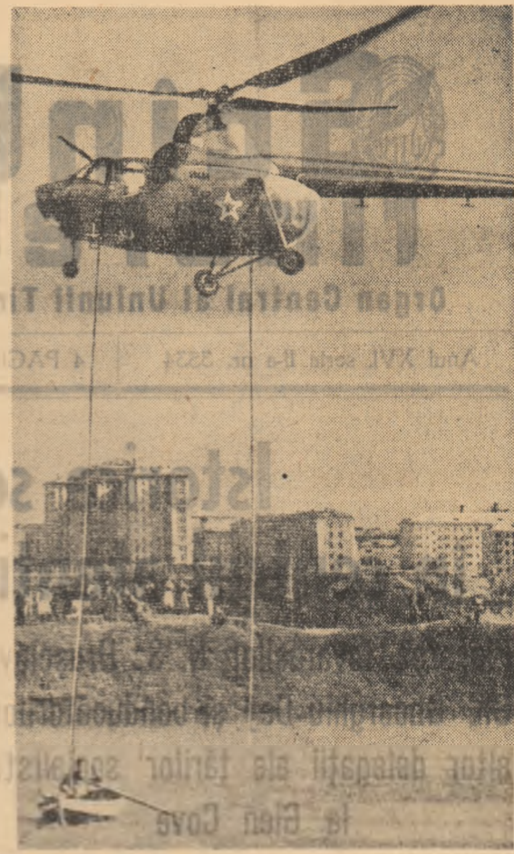
Exerciții de aruncare a unei încărcături din elicopter în bancă.