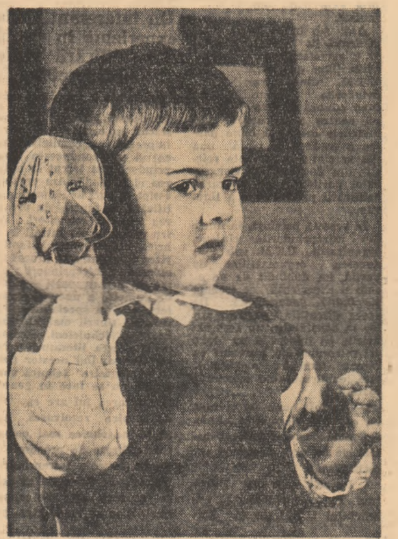
Ce-o fi întru?