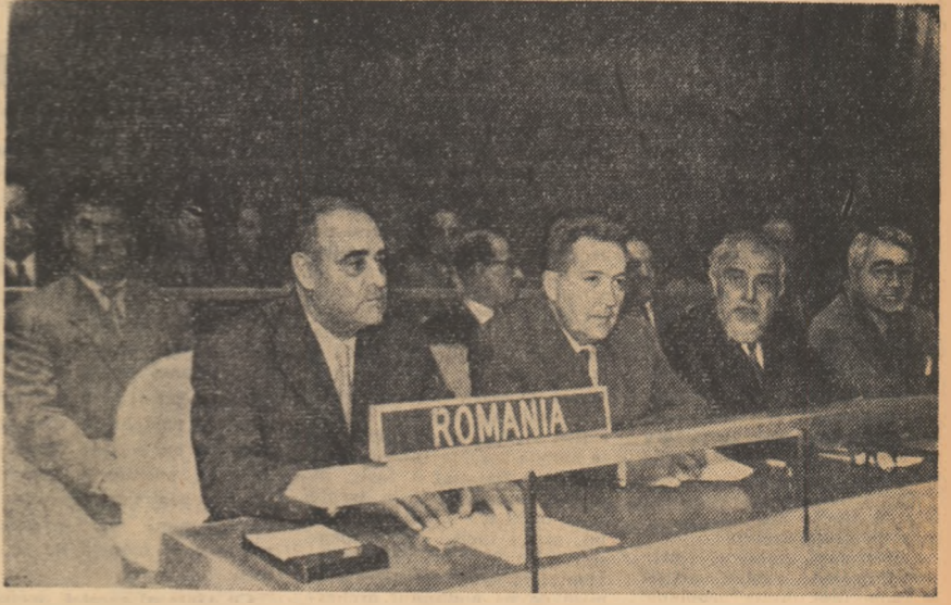
Membrii delegației R. P. Române, în frunte cu tovarășul Gh. Gheorghiu-Dej, în sala de ședințe a Adunării Generale a O.N.U. (TELEFOTO)

Plecarea tovarășilor N. S. Hrușciov, Gh. Gheorghiu-Dej și conducătorilor altor delegații ale țărilor socialiste la Glen Cove NEW YORK 24 (Agerpres). — TASS transmite: La 24 septembrie, N. S. Hrușciov, președintele Consiliului de Miniștri al U.R.S.S., șeful delegației sovietice la cea de-a 15-a sesiune a Adunării Generale a O.N.U., a plecat din New York la Glen Cove, unde de obicei își are sediul delega-