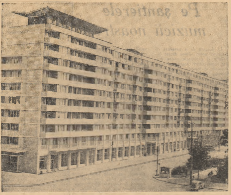
Noul blocuri de locuințe construite în fața Gării de Nord.

Citiți pag. 2-a: Din duminică în duminică