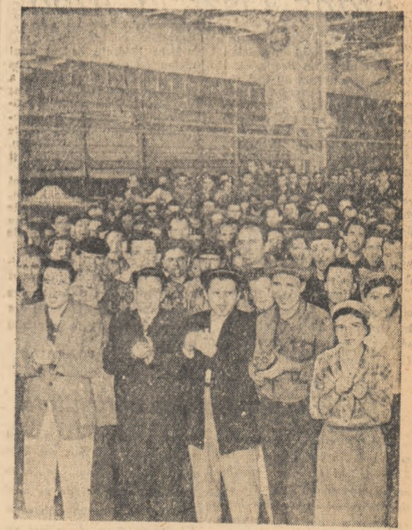
Aspect de la adunarea de la Uzinele „Timpuț Noi” din Capitală în care muncitorii și-au exprimat deplina adiere față de politica de pace a statului nostru.