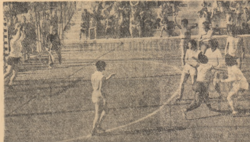
O imagine din întâlnirea feminină de handbal în 7 „Progresul” București — „Record” Mediaș.