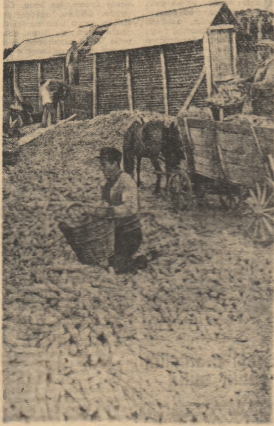
Grămezii însemne de aur s-au stîrnit în aceste zile în preajma păturilor gospodăriilor agricole colective „Victor Neștu” din comuna Fălticeni, raionul Fălticeni. Răpăcit 3000 de kilograme de boabe de porumb la hectar au obținut colectivitățile în toamna aceasta. În fotografie: Activitate intensă la încadrarea hembelor.