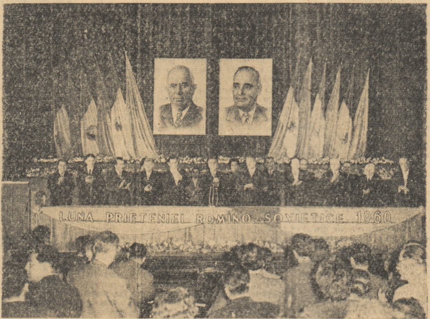
Aspect de la adunarea festivă cu prilejul deschiderii Lunii prieteniei romîno-sovietice