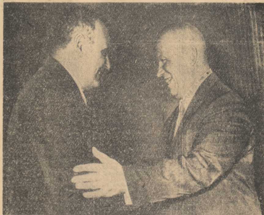
Tovarășii N. S. Hrușciov și Gh. Gheorghiu-Dej în timpul recepției de la sediul misiunii R. P. Romîne la New York.