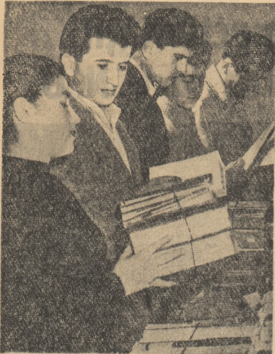
Cărți noi pentru biblioteca personală.