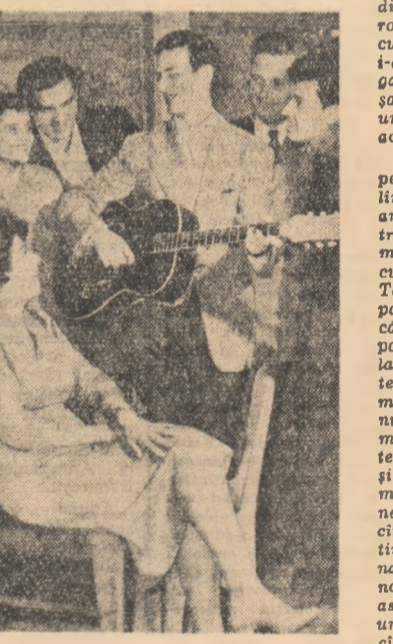
În acorduri de chitară...

În ceea ce privește organizarea joier tineretului, este bine să știi că în fiecare săptămînă răspunde de acest lucru cîte una din organizațiile de secție U.T.M. Responsabilul cu munca culturală din biroul organizației de secție respectivă se interesează din timp de problemele pe care ar dori tinerii să le cunoască și a măsurile necesare. Nu de mult s-a observat, de pildă, că a început să scadă numărul tinerilor care participă la vizionările colective de la club ale programelor de televiziune. Cercetîndu-se acest lucru, s-a constatat totuși o situație îmbucurătoare: un număr însemnat de muncitori viranți și tineri și-au cumpărat televizoare. Stîndu-se de vorbă cu ei, s-a aflat că ar dori să știe mai multe despre felul cum s-a construit și cum funcționează, cum se folosește un televizor. S-au luat măsurile necesare și, la prima ocazie a înțelegătoare, un conferențiar pe tema „Cum să te porți față de televizor”. Așa, abordîndu-se probleme care interesează în mod deosebit pe tineri, se poate asigura un succes real joier.