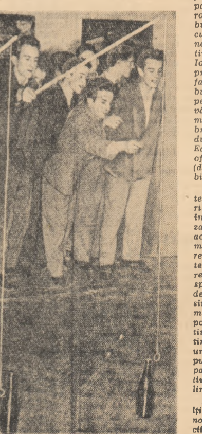
„Pescutul” nu-l chiar așa ușor.