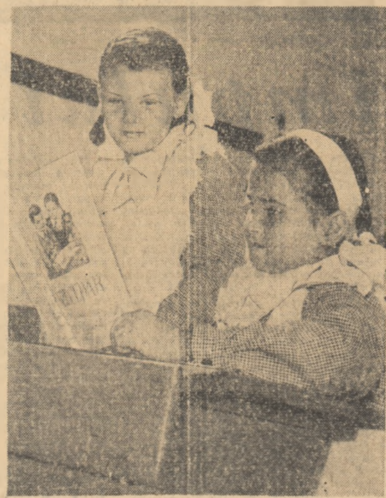
La ce literă am ajuns?

O mare însemnătate pentru eficientizarea cursurilor o are programul analitic. De felul cum este ea orientată, depinde pregătirea muncitorilor, aportul pe care-l vor aduce aceștia în procesul de producție. În general, programele analitice cuprind lucruri utile tinerilor. Există însă și aici multe neajunsuri. Să luăm de exemplu repartizarea orelor pe obiecte. În cursul pentru operatori, pentru obiectul cunoașterea utilajului s-au alocat 16 ore. Cine poate crede că ele ajung pentru că tinerii să-și însușească noțiuni privind materialele, de protecția anticorrosivă, reacțiile care se produc în fiecare recipient, parametrii de funcționare (Unii ingineri sînt de părere că ei 48 de ore ar fi puține). Tot aici s-au alocat 6 ore pentru cunoașterea aparatelor de măsură și control. Nu este deei de mirare că sînt tineri care încă nu cunosc suficient sensibilitatea aparatelor, pentru a putea preîntîmpina defecțiunile. O altă problemă este aceea că unele programe, dau tinerilor noțiuni elementare, care-i ajută să se descurce pentru moment la locul lor de