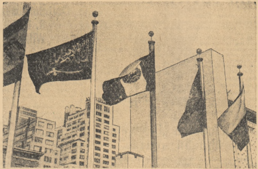
La mii și mii de kilometri depărtare de țară flutură lângă sediul O.N.U. drapelul iubit al patriei noastre, Republica Populară Romînă.

La sfîrșitul acestei săptămîni, Organizația Națiunilor Unite va număra prin primirea Nigeriei 100 de membri. În această organizație al cărei caracter trebuie să devină și din ce în ce mai universal poziția arcașilor încordării și războiului rece este din ce în ce mai dificilă.