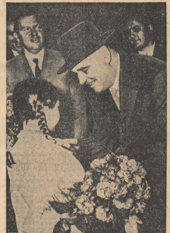
Copii ai membrilor misiunii R.P. Romine de pe lângă O.N.U. oferă flori tovarășului Gheorghe Gheorghiu-Dej.

au urcat pe bordul transatlanticeului „Queen Mary”. La ora 12, ora locală (ora 18, ora Bucureștiului) transatlanticeul a ridicat ancora, îndreptându-se spre Europa.