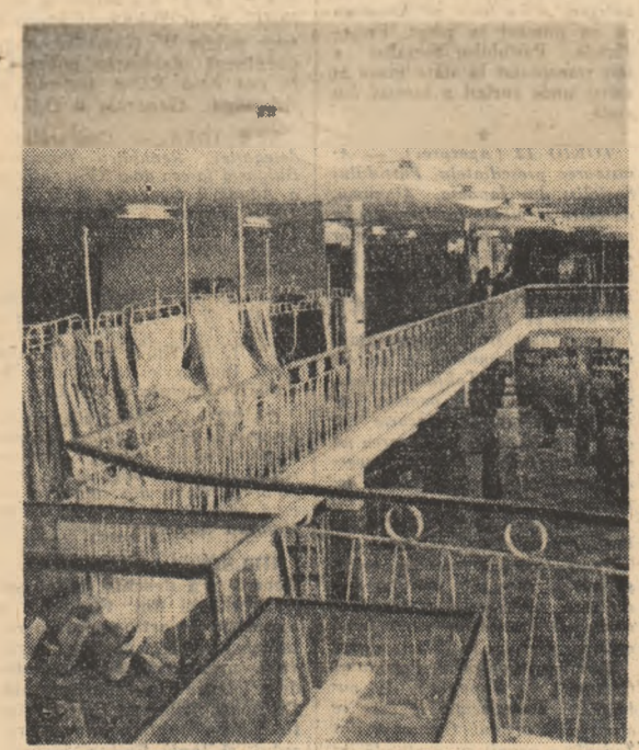
Aspect interior din noul magaz. z. universal „Centrocop”, dat recent în folosință în orașul Hirșova, regiunea Constanța.