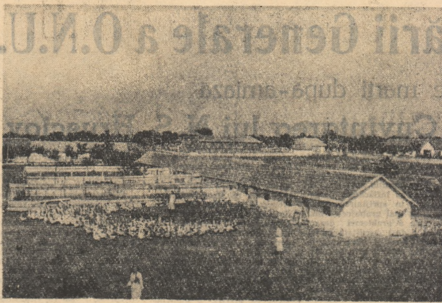
O parte a fermei de pășuni din G.A.C. „Tractorul” comuna Vulturul, regiunea Constanța, care a sărbătorit recent 10 ani de la înființare.