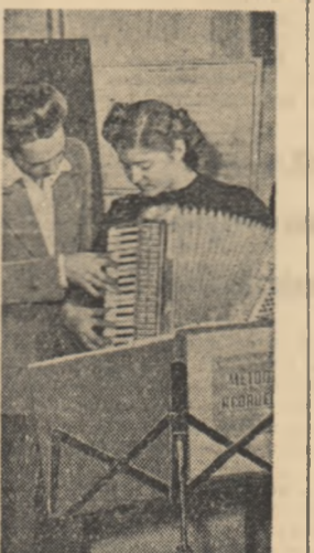
Lecție de acordeon