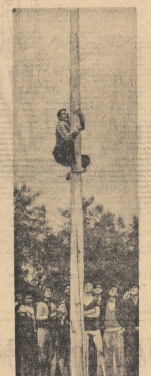
„Cînd se gîndești că stîlpul e alunecos rău...”

Local pionierilor l-au luat coriștii, recitatorii, dansatorii. Un program artistic făcut anume să incite și vîzul și auzul spectatorilor; un program în care înfălcărea tineretii și măiestria interpretării s-au contopit ca să creeze bunăvoia cîrjenilor. Strășnic mai băteau în podele, ba fetele, ba flăcăii, ba împreună, jucînd „Ghimpele”, „Șirba cu strigături”, „Joița” și „Clobănașul”. Boțu juca mai