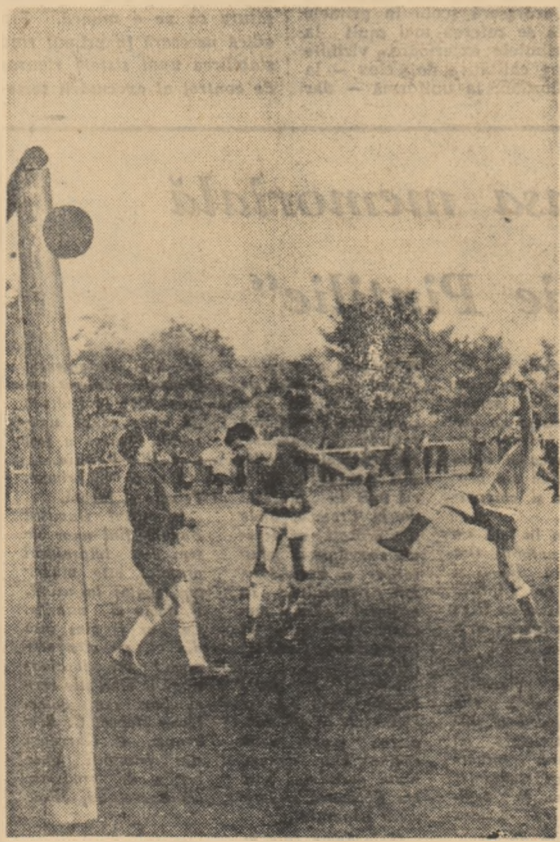
Un sut, o pasă, un „oop” și...bură! Ah, parcă am fi în categoria A!

Să fi fost orele 14 cînd de pe ulițele satului, picuri de soarelui veneau spre terenul de sport din mijlocul comunei. Se anunța un program sportiv variat. Nu lipsit de numere atractive, ba chiar și de discipline sportive originale. Stai să vezi. Ai fost vreo dată la campionatul republican de atletism? Atunci știi: tocmai cînd începe al treilea tur în proba de 1500 m, vocea cronicului răsună în