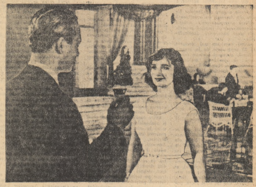
O scenă din film.