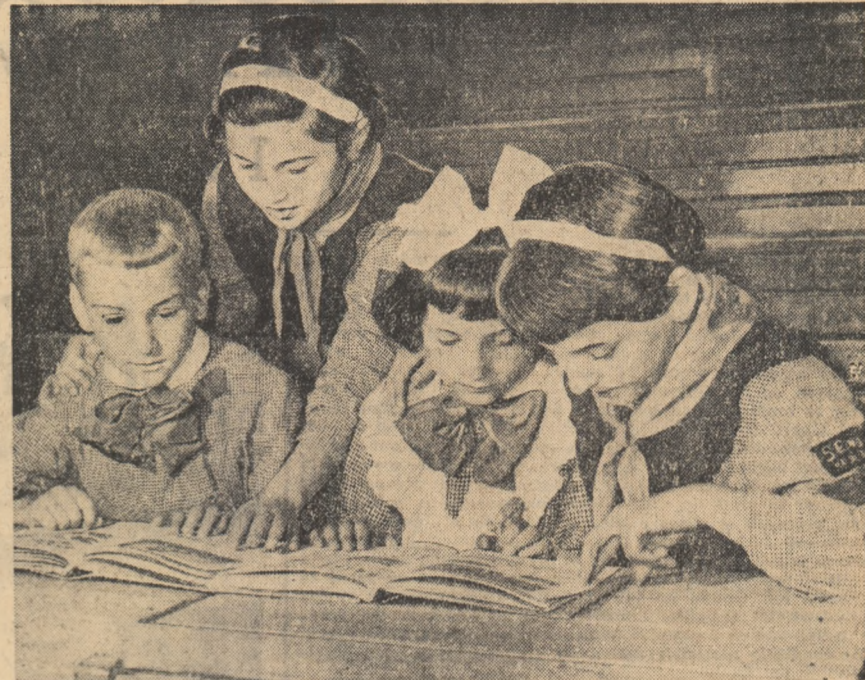
Cit de complicat este abecedarul... Ajutorul colegilor din clasele mai mari este de ocea binevenit intotdeauna.