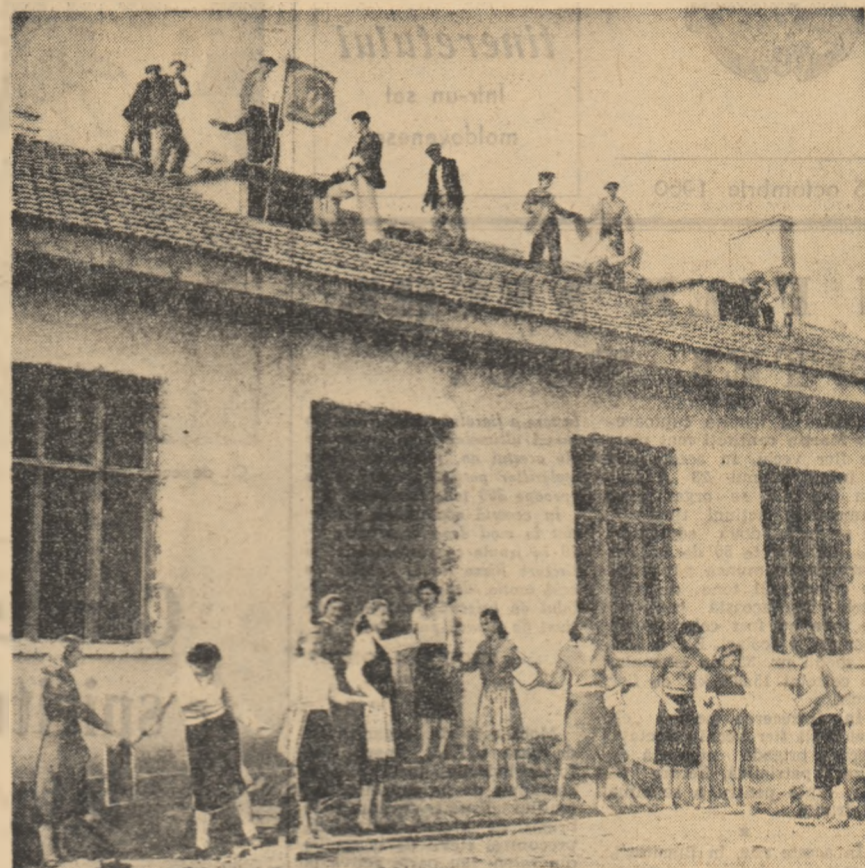
Țiglele trec din mîna-n mîna, școala cea nouă se fi mai repede gata.

diuzoare: liniște vă rog! la înălțime sare cutare... Repede întorci capul; nu? E! În mic, cam așa, în timpuri paralele, s-au desfășurat probele sportive pe terenul din comuna Cîrja, de pe malul Prutului, duminică 9 octombrie a.c.