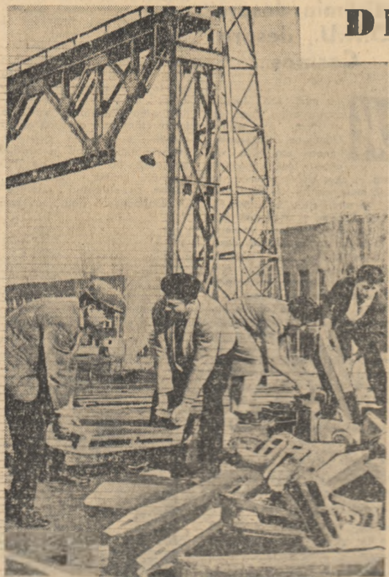
Azi fier vechi, mine oțel nou. Numeroși tineri de la Uzinele „23 August” din Capitală, participă la acțiunile de colectare a fierului vechi.

În cadrul pregătirilor pentru iarnă o atenție deosebită a fost acordată și asigurării procesului de producție cu cantități de materie primă necesare. Pînă în urmă cu câteva zile se așteptau să se pregătească circa 45.000 de tone de argilă marcată.