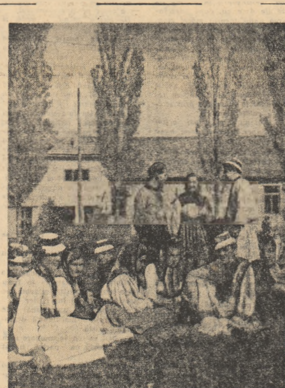
Un grup de elevi și eleve ai clasei a XI-a a Școlii medii din comuna Negrești — Jara Oașului — în timpul liber.