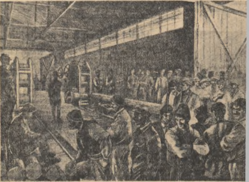
Deșea reprezentînd un aspect al grevei muncitorilor forestieri din Valea Mureșului în 1920.