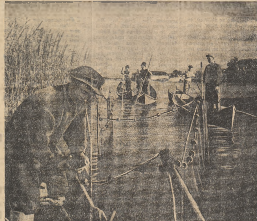
Brigada piscicolă de la G.A.C. Somova, raionul Tukeya, la lucru.