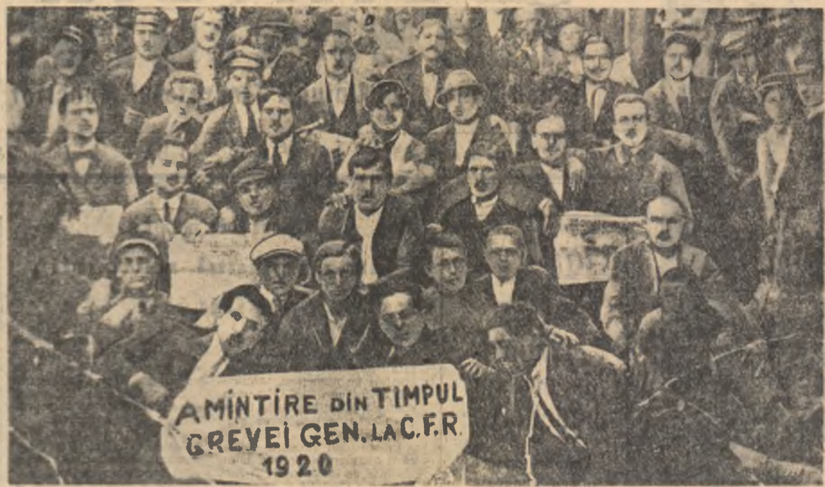
Un grup de muncitori ceteriști participanți la greva generală din 1920.