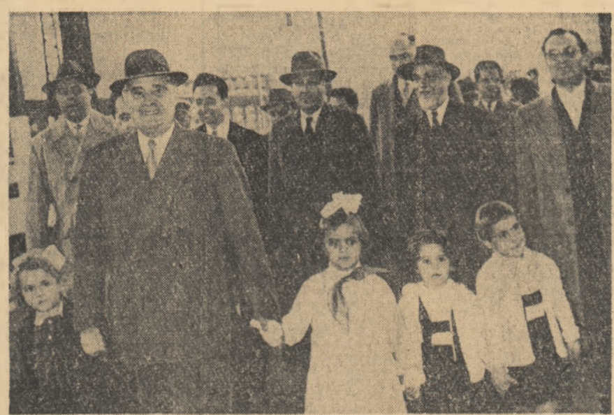
Tovarășii Gheorghe Gheorghiu-Dej, Leonte Răutu și Ștefan Voitec la sosirea în capitala Franței

PARIS 17. — Corespondenții Agerpres transmite: Luni 17 octombrie, tovarășul Gheorghe Gheorghiu-Dej, conducătorul delegației romine la cea de-a XV-a sesiune a Adunării Generale O.N.U., precum și tovarășii Leonte Răutu și Ștefan Voitec au sosit în Franța în drum spre patrie.