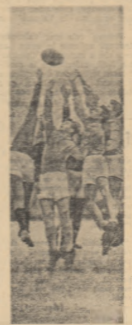
O aruncare de la țupă, disputată în cadrul meciului de rugbi dintre echipele Asociației sportive „Aeronautica” și „Sirena”.