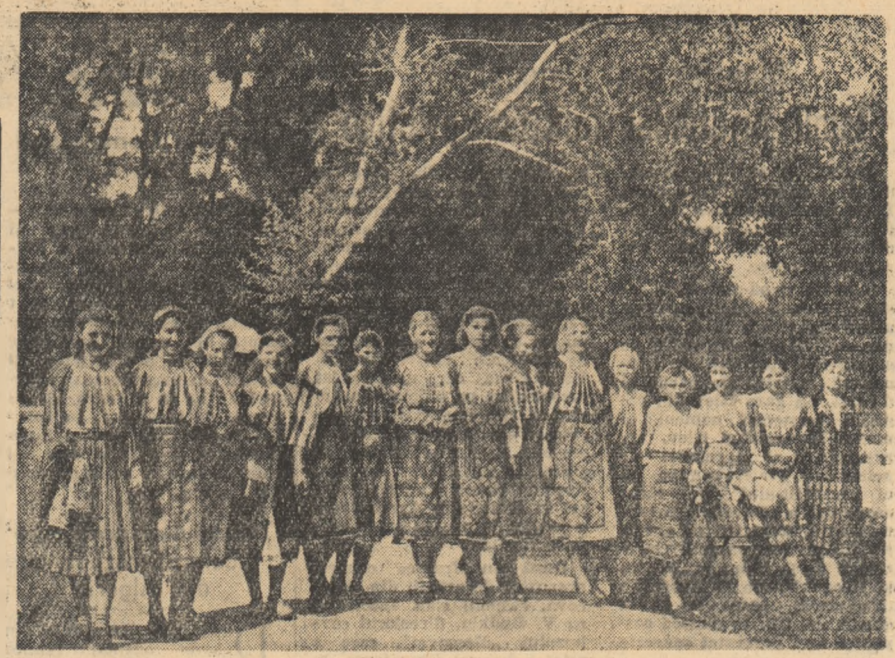
Tinere fete din regiunea Pitești în zi de sărbătoare.