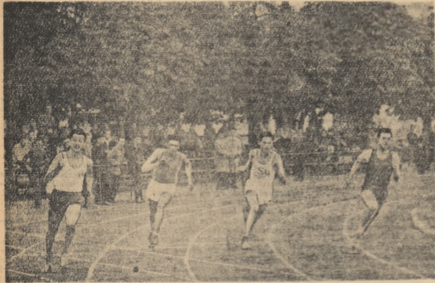
Campionatul de atletism pe echipe al orașului București organizat pe Stadionul Tineretului a reunit la start pe cei mai buni atleti ai Capitalei. În proba de 200 m. plat.