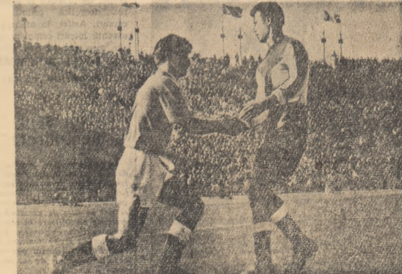
„Scuză-mă că te-am faultat” — îl spune (sincer sau nu) Motroc lui Biberu. Frumos gest nimer de zis. Dar și mai frumos ar fi dacă n-ar mai fi deloc faulturi la meciurile de fotbal.