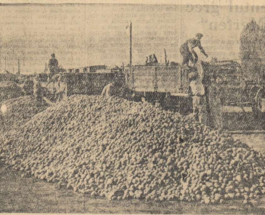
În Capitală, ca de altfel în întreaga țară, se desfășoară intens muncă de aprovizionare a populației în vederea sezonului de iarnă. În fotografie: un nou transport de cartofi a sosit în Gara Filaret.

La concurs se pot prezenta și absolvenții școlilor echivalente de Ministerul Învățământului și Culturii cu școlile tehnice de maștri și care au practică de maștru.