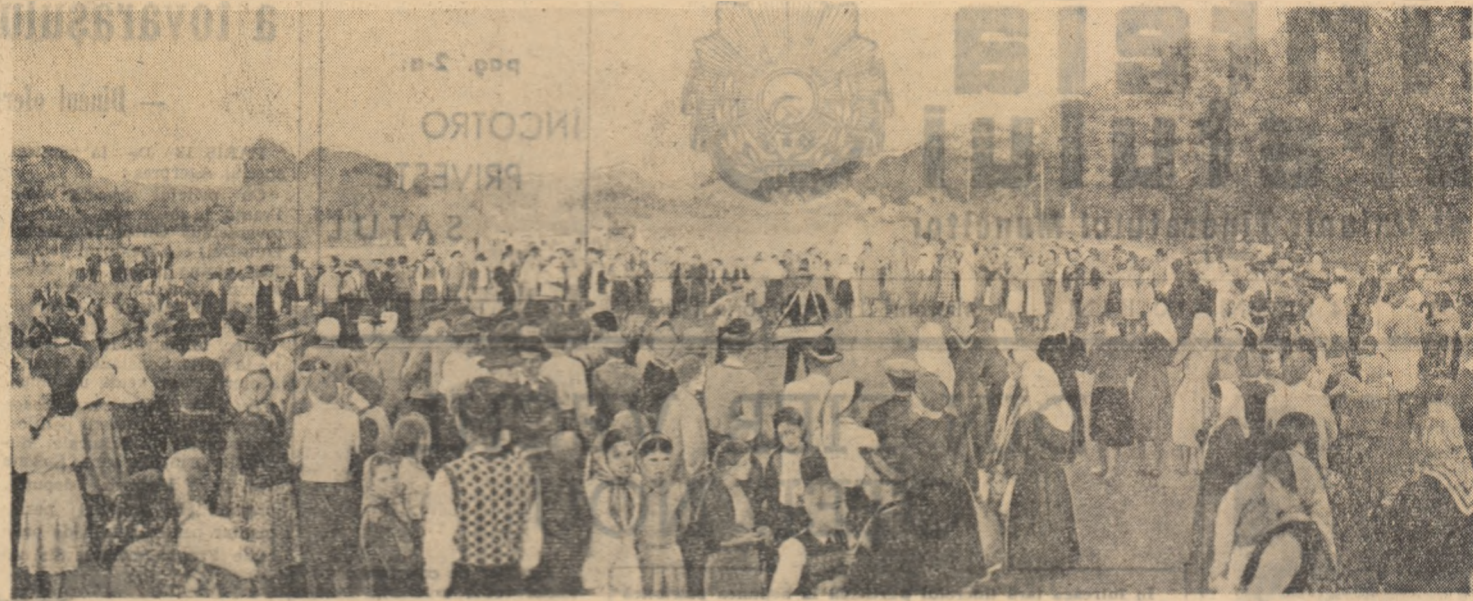
Un eveniment deosebit, o sărbătoare cum n-a mai fost... La Curcani, în raionul Oltenia, s-a inaugurat de curînd o nouă gospodărie colectivă. 301 familii și-au unit în gospodărie cele 1210 hectare. O nouă viață începe pentru colectiviștii din Curcani. Iată-i acum uniți în gospodărie și în horă.