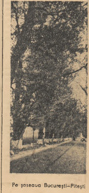
Pe șoseaua București-Pitești