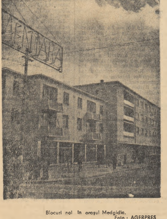
Blocuri noi în orașul Medgidia.