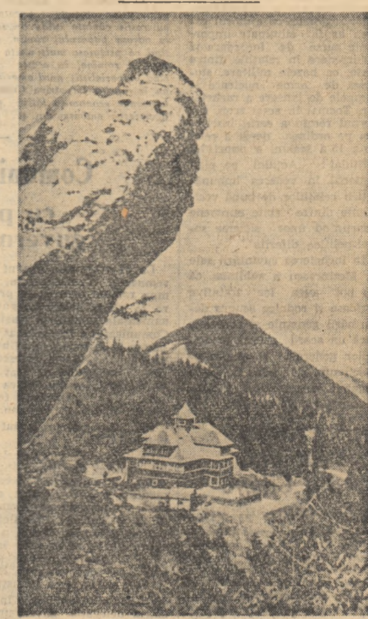
Cabana Rarău

Glogoveț mi-am adus aminte de ea și-mi pare rău că n-am avut vreme să-i spun. Nu de alta, dar pentru că prezența lui mi ajută să continui într-un amănunțiu. Dacă pe vremurile acelea, din toată muncă și jalea urieșilor nu s-au ales decât podoba lucrurilor și citeva dealuri, de care oamenii nu duceau lipsă pe la noi — iată, azi din Glogoveț caboură un tinar, numai că s-a furnică pe lângă consenții lui din basm și împreună cu alți vecini de-ai noștri înalță o cetate adevărată, o cetate industrială, pe Cîmpia Libertății. Astăzi oamenii fac posesiile să devină adevărate. Ei sînt urieși din zilele noastre. Mulți, în toate colțurile țării.