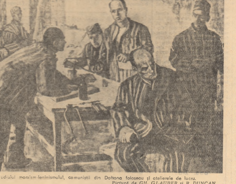
Pentru desfășurarea studiului marxist-leninist, comuniștii din Doftana foloseau și atelierul de lucru. Pictură de GH. GLAUBER și R. DUNCAN