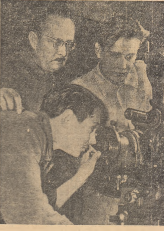
Tineri elevi ai unei Școli profesionale din R.D.G. învață minutul frezei sub îndrumarea atentă a maestrului.

MOSCOVA 29 (Agerpres). — TASS transmite: Comitetul organizațiilor de tineret din U.R.S.S. a dat publicității o declarație de protest împotriva persecuțiilor polițienești din Portugalia. În numele tinerilor și tinerelor din Uniunea Sovietică, Comitetul se pronunță în sprijinul revendicărilor patrioților democrați din Portugalia pentru imediată eliberare a tuturor deținuților politici din această țară.