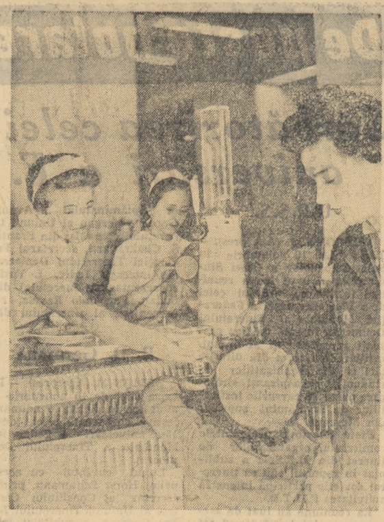
În noul magazin „Polar” din Capitală se servesc și copiilor cocktailuri. E drept, cocktailuri de lapte.