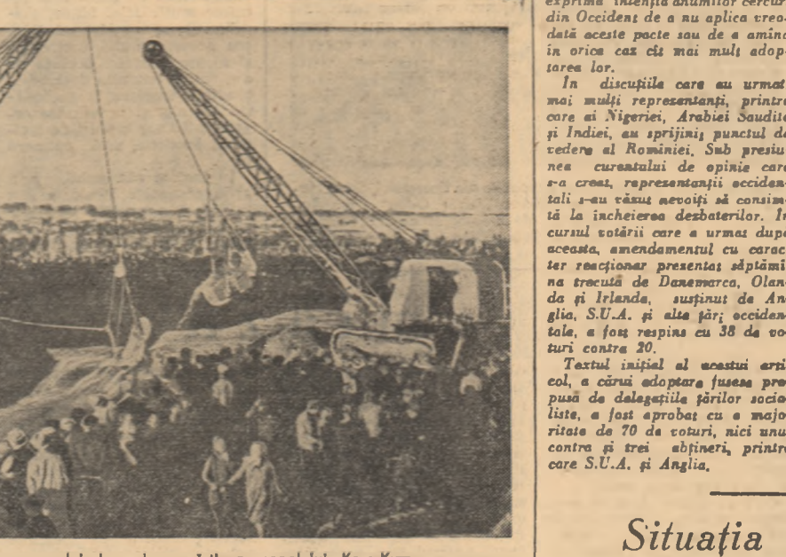
Aspect de la inaugurarea celei de-a doua părți a canalului Kara-Kum.

În același timp el a declarat că „orice guvern american va apăra baza maritimă militară de la Guantanamo din Cuba”.