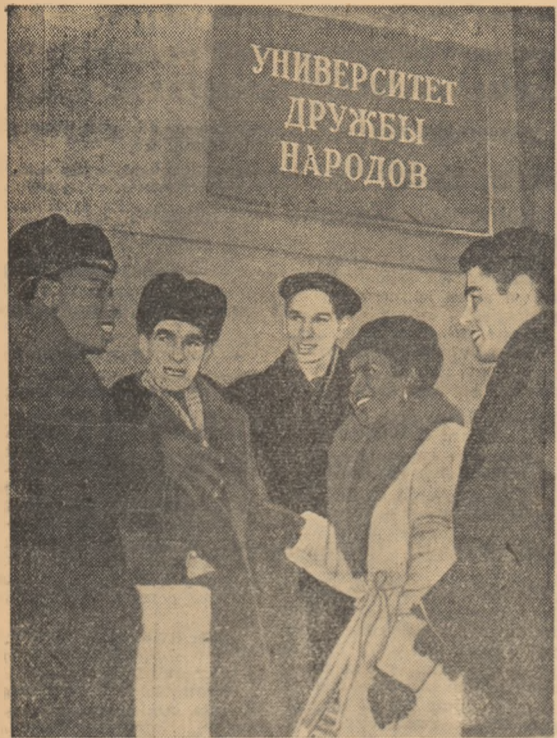
Au început cursurile Universității prietenilor popoarelor. Într-o grupă de studenți. Sînt tineri din Sudan, Cuba, Ghana, Brazilia și U.R.S.S.