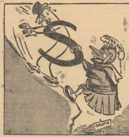
„MISTER DOLAR”: = Acest însoțitor mă duce de răpă!... (de V. TIMOC)

Scăderea rezervelor de aur ale S.U.A. a zdruncinat serios poziția dolarului pe piața monetară internațională.