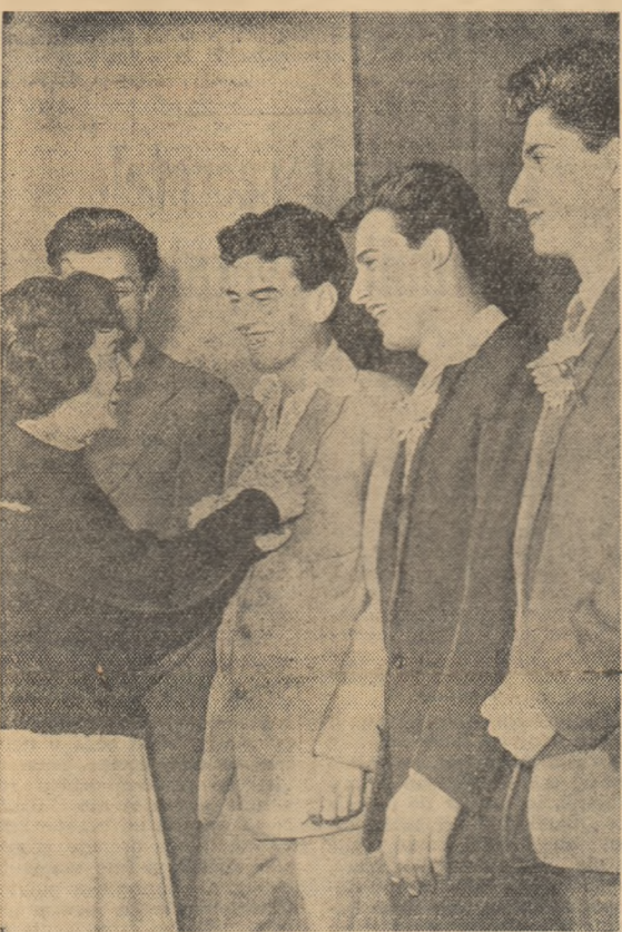
Pentru fiecare sărbătorit... o crizantemă.