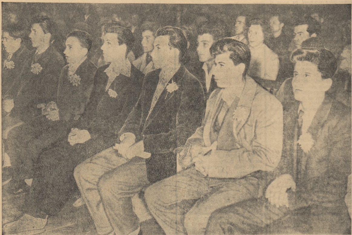
Sărbătorii ascultă cu atenție și emoție cuvântul muncitorilor vîrstnici.