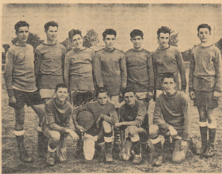
Sportul cunoaște o tot mai largă răspîndire în rândurile tinerilor săteni. În fotografie: Echipa de fotbal din comuna Cișia, regiunea Iași.