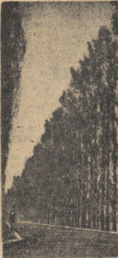
lee de plop în Copșa Mică.