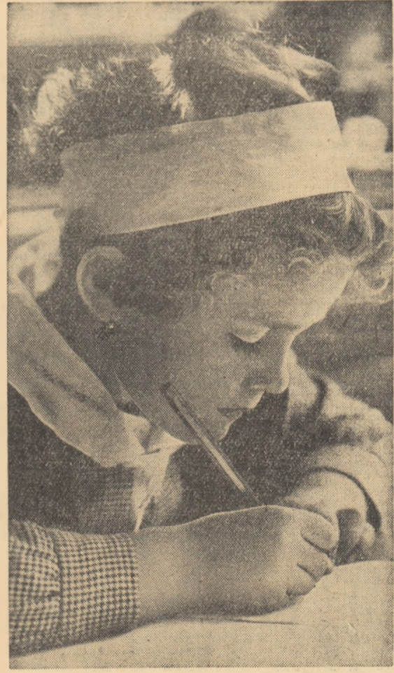
Spre prima literă din alfabet...

Cu același avion a călătorit spre patrie delegația de partid și guvernamentală a Republicii Populare Bulgarie, alcătuită din tovarășii: Todor Jivkov, prim-secretar al C.C. al P.C. Bulgar, conducătorul delegației, Anton Iugov, membru al Biroului Politic al C.C. al P.C. Bulgar, președintele Consiliului de Miniștri, Dimităr Ganev, membru al Biroului Politic al C.C. al P.C. Bulgar, președintele Prezidiului