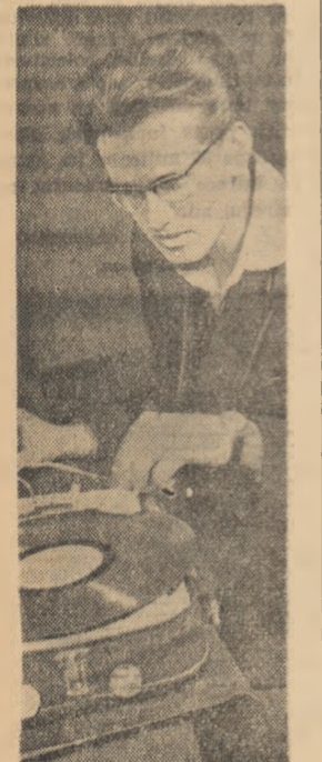
Zilnic, de la stația de radio-floare a căminului nr. 2 a Institutului politehnic din Timișoara se transmite emisiuni muzicale interesante.