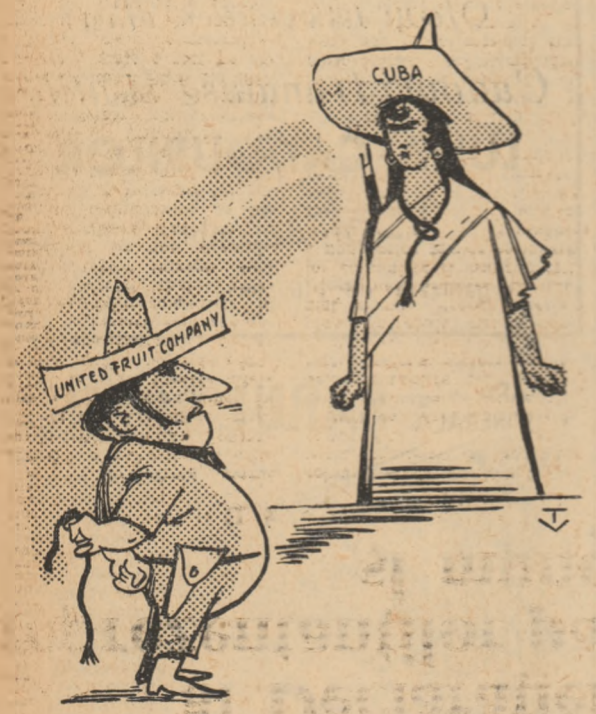
Ah, senora, nu daresc decât să reînnoșăm firul „prieteniei”...

„Lagărul comunist dorește pacea”, subliniază ziarul „Prensa”.