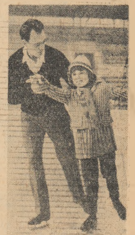
La prima lecție de patinaj.

Realizările obținute de muncitorii din unitățile de transporturi auto din țară în cele 11 luni care au trecut din acest an au dus la îndeplinirea planului anual. Prin reducerea consumului de cauciucuri și benzină, a cheltuielilor de întreținere și reparării, prețul de cost pentru transportul unei tone/km de mărfuri a scăzut simțitor. Drept rezultat, colectivele întreprinderilor de transporturi auto din țară au economisit în 10 luni, peste plan, aproape 37 milioane lei, sumă ce întrece angajamentul pe întregul an. (Agerpres)