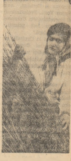
Da, este nevoie de o grijă deosebită. Din aceste mîci- țe vor crește viitorii pomi fructiferi.