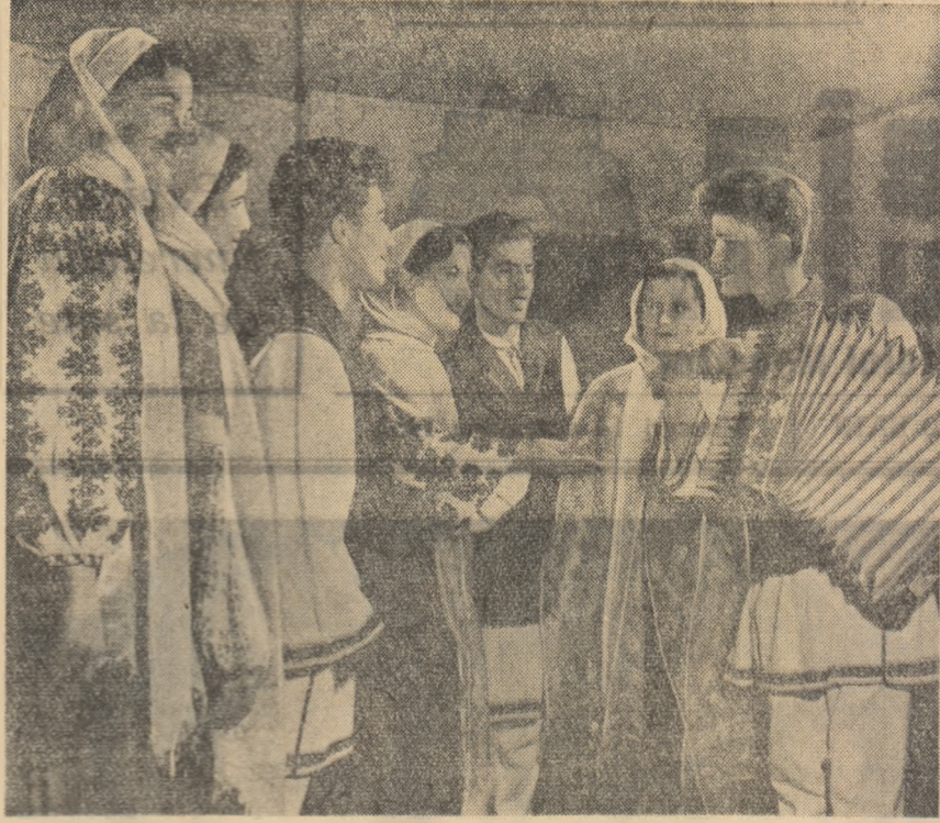
Program nou și interesant prezentat de brigada artistică de agitatie a caminului cultural din comuna Modelu, raionul Călărași.

Gospodăriile agri- cole colective din regiunea București au produs pînă acum la bazele de recepție 85 la sută din cantita- tea de porumb con- tractată. Numai din vinzarea porumbului gospo- dăriile colective din regiunea au înecat 117.000.000 lei. O parte însemnată din această sumă a fost plătită încă de la încheierea contracte- lor. Gospodăriile agri- cole colective au putut astfel să im- partă colectivitatii avansuri lunare sau trimestriale pentru zilele muncii elec- tuate. Producțiile mari obținute în acest an au permis multor gospodării colective să vîndă statului cîte 50-150 tone porumb peste sarcinile con- tractuale. Printre a- cestea se numără gospodăriile agricole colective din Grindu, Covarceana, Radu Vodă, Valea Biseri- cii, Gheorghe Lazăr, Mărușești, Dragoș Vodă, Crucea și al- tele. (Agerpres)