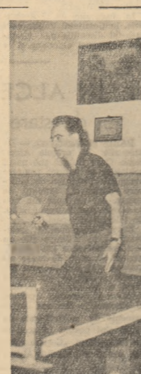
Tineri de la Uzina „Klement Gottwald” din Capitală evoluind la tenis de masă în cadrul întrecerilor Sportochioidei de iarnă a tineretului.

Nu mai puțin importantă este și problema de a organiza periodic vizionări colective de spectacole la Casa de cultură a tineretului, să se țină concursuri sportive, conferințe etc. care să-l ajute pe tiner să-și petreacă în mod plăcut și educativ timpul liber, să contribuie la îmbogățirea orizontului lor politic și de cultură generală.