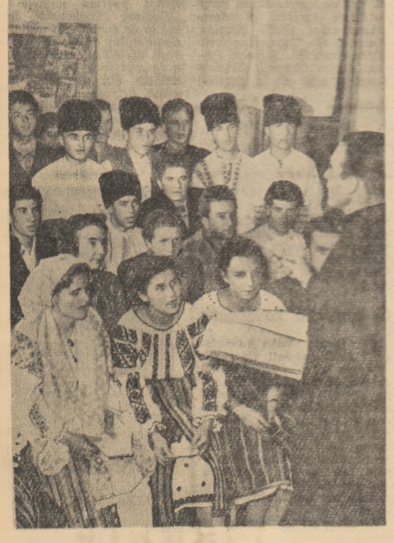
„Să fii partidului oștean”, răsună plin și armonios vocile tineretului în sala căminului cultural din comuna Dumitrești, raionul Rîmniceu Sărat.