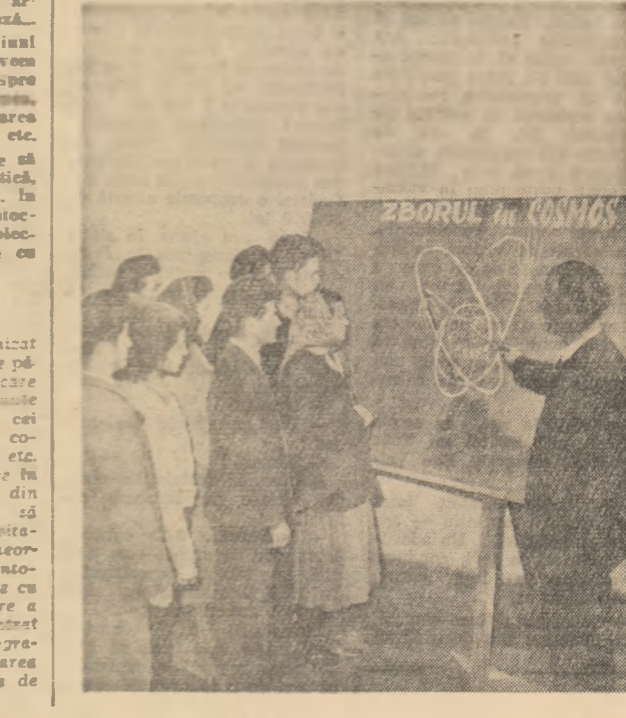
Pe o trilectorie asemănătoare vor porni în Cosmos primii astronauți! Tinerii din cercul naturalizatorilor din comuna Băbeni, regiunea Ploiești urmăresc de pe acum, cu imaginație, zborul îndrăznețelor.