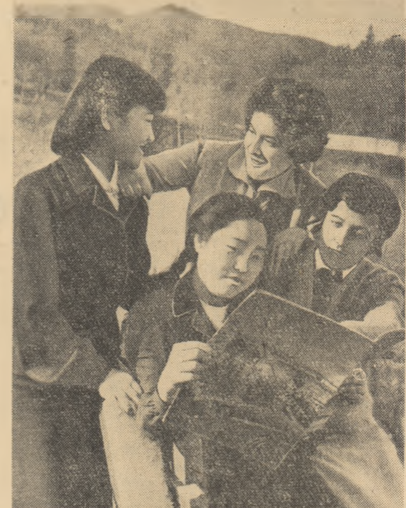
O convorbire prietenească între eleve coreene și romince de la Centrul școlar metalurgic de pe lângă Uzinele „Steagul Roșu” Brașov.