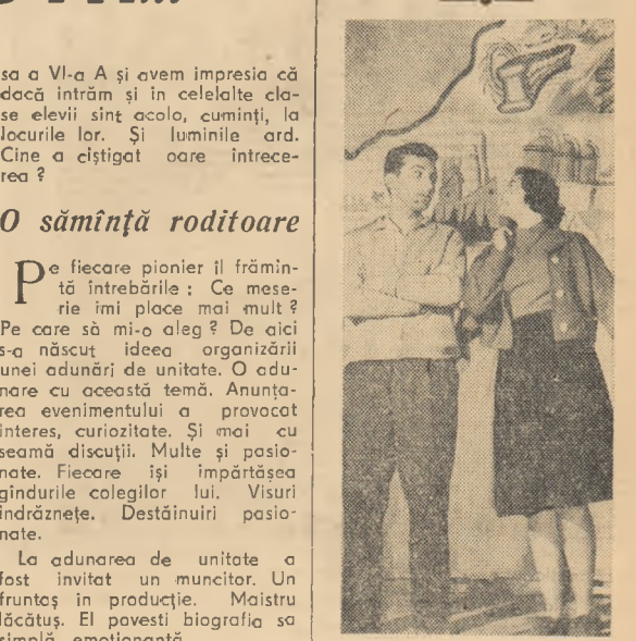
Studenți din brigada artistică de agitație de la Universitatea „Alexandru I. Cuza” din Iași în timpul unei repetiții.