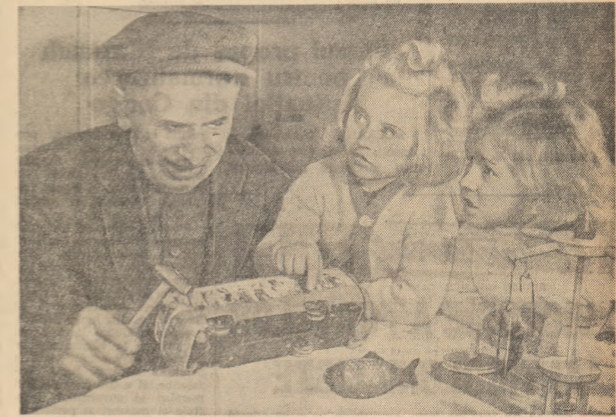
Să separe jocuina nepoților nu e lucru tocmai ușor...

Celor prezenți le-a fost oferit un bogat program artistic.