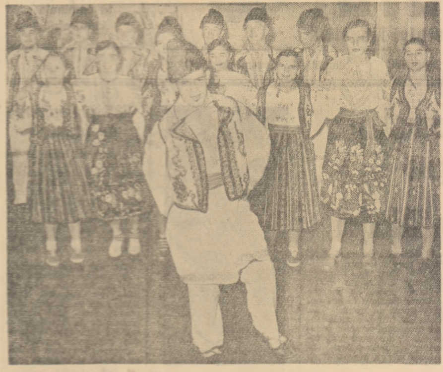
O vîntă repetiție înainte de concurs și poartă echipa artistică a căminului cultural din Măglaș. În mijloc se află un premiu la concursul intercomunilor de la Motăței.

Printre cele mai importante forme pe care poate să le îmbrace activitatea culturală în timpul iernii sînt: acțiunile în vederea unei cit mai largi răspîndiri a cărții, cercurile naturalizatorilor, urmîrind înamarea tinerilor cu cunoștințe științifice despre natură și societate, învățarea în comun a cîntecelor patriotice-revoluționare, pregătirea unor spectacole ale echipelor artistice de agitație sau formațiilor de teatru, concursuri pe diverse teme inspirate din viața nouă a satului etc. Comitetele U.T.M. trebuie să cunoască dorințele tinerilor, consultîndu-i asupra celor ce vor să se organizeze la cămin și să întocmească împreună cu colectivele de conducere ale căminelor programele cele mai potrivite pentru ridicarea continuă a nivelului politic, ideologic, cultural al tineretului.