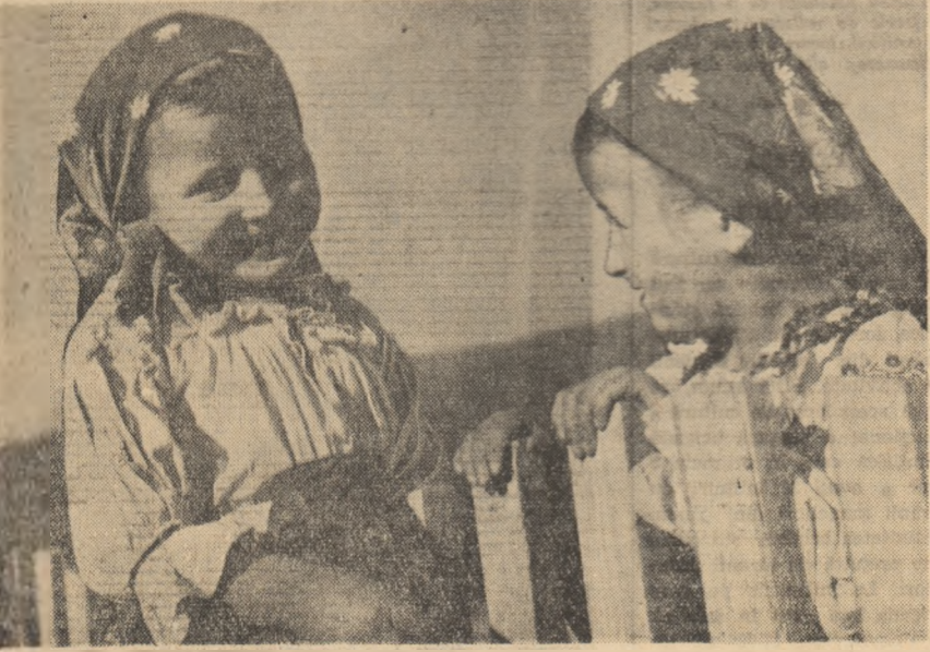
Slat la poartă.

Acest număr se deschide cu articolul „Un document - program al mișcării comuniste mondiale” semnat de Ștefan Voicu. Sînt publicate de asemenea, printre altele, articolele „Creșterea bunăstării oamenilor muncii - obiectiv suprem al politicii partidului” de Manea Mănescu, „Partidul Comunist Francez la a 40-a aniversare” de Jacques Duclos. La rubrica „Din experiența conducerii de partid a economiei” putem citi articolul lui V. Mihău - „Munca organizatorică și politică concretă, cheia în îndeplinirea planului de stat”. Sînt publicate de asemenea rubricile „Din presa partidelor comuniste și muncitorești”, „Critică și bibliografie”.