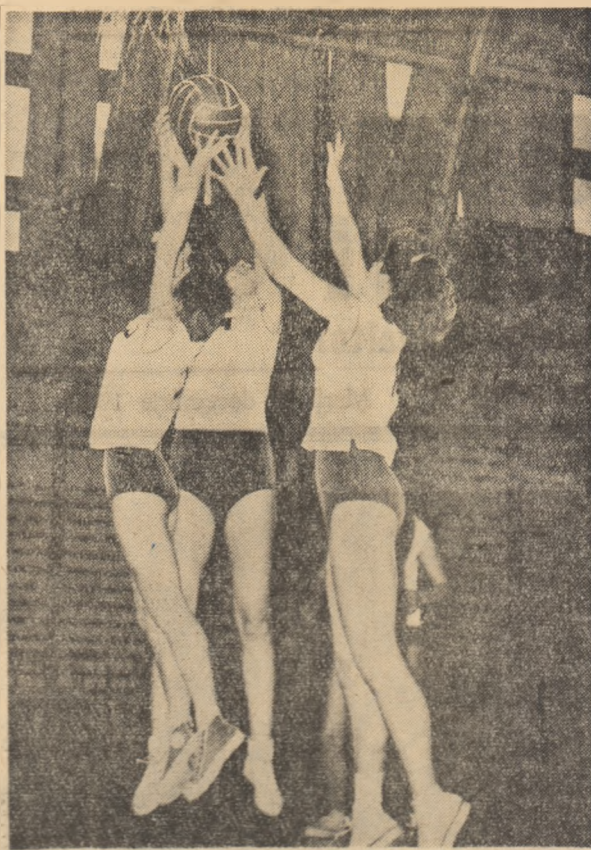
O imagine din întâlnirea feminină de baschet: „Mureșul” Tg. Mureș - „Constructorul” București disputată duminică în sala Dinamo.