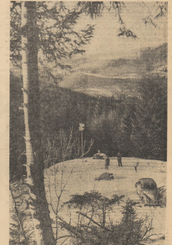
Peisaj în drum spre Prislop.