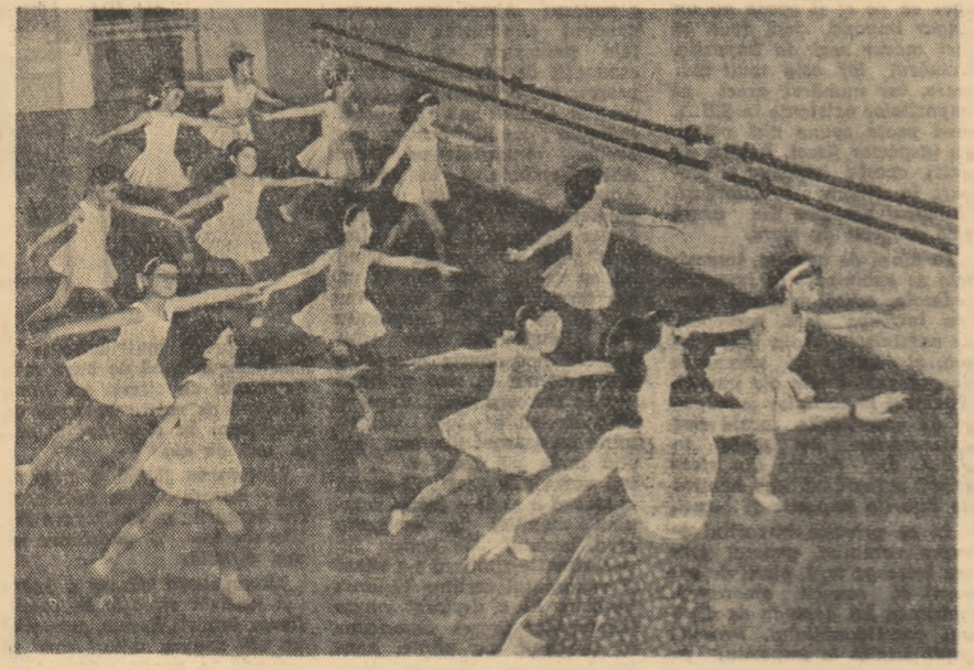
La Cercul de balet al Casei de Cultură din Brașov.