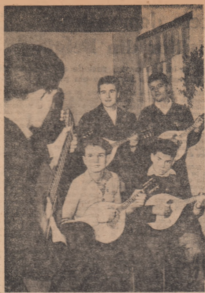
În fotografie: o parte din echipa de mandoline a Complexului Școlar de pe lângă Uzina de autocomioane „Steagul Roșu” din Brașov.