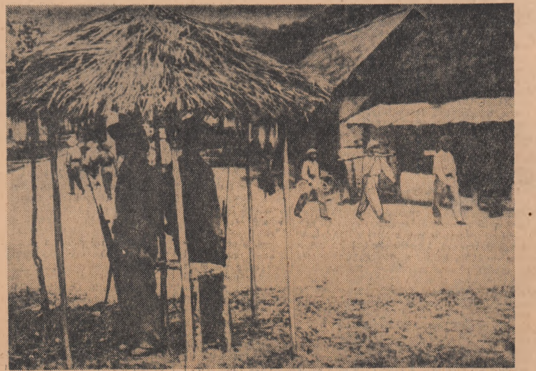
O bază a unei unități Patet Lao situată în partea nordică a Laosului.

Evoluția luptelor militare a stîrnit alarmă în S.U.A. Riposta hotărîta dată de forțele patrioțice din Laos către Nosavan — Oum incursiune planurile elaborate la Washington, atunci s-a căutat o nouă formulă pentru o intervenție directă a armatei americane în Laos. Din învechitul arsenal al calomniilor antisovietice a fost scoasă la iveală „plîngeră” cu privire la o preținsă „invazie” a U.R.S.S. și R.D. Vietnam în Laos. Mincina este aiută de evidență și de grosolan, falsul este atît lipsit de abilitate, încît S.U.A., s-au trezit într-o situație penibilă: nici măcar alieții apropiați nu dau crezare născocirii. Împotriva, cercuri influente din Anglia și Franța făcînd publice divergențele cu S.U.A. îndeamnă la pruc-