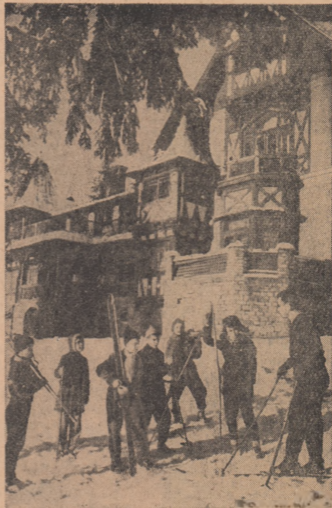
Statoriile unui specialist sint binevenite inainte de a pleca cu schiurile.