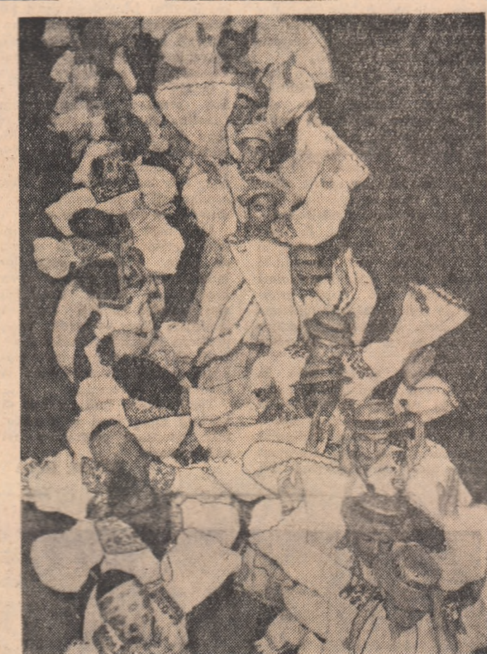
In iureșul dansului. (Echipa de dansuri a Școlii pedagogice Buftea).