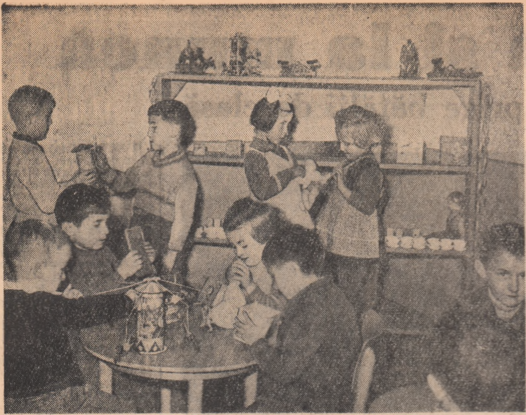
In aşteptarea zăpezii, copiii colectivizilor din Cenad nu se plictisesc.