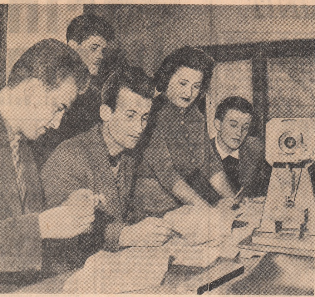
Studenți din grupa 232 a Facultății de foraj (Institutul de petrol, gaze și geologie din București) în timpul unei consultații.