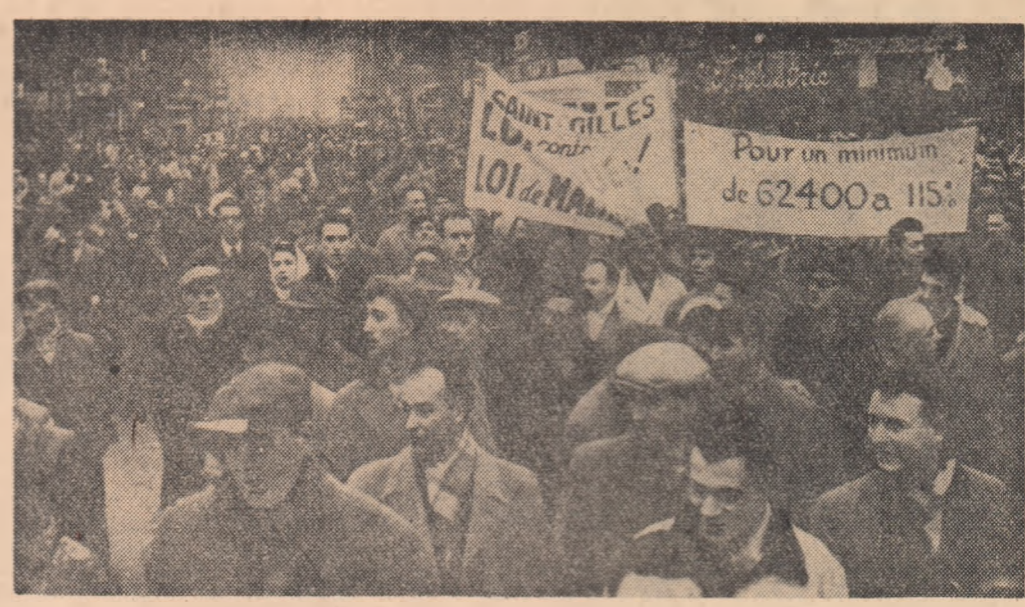
Capitala Belgiei — Bruxelles — în aceste zile de grevă generală.

Revista franceză „Express” subliniază că ritmul de creștere a economiei Belgiei este cel mai mic din Europa occidentală. În aceste condiții — scrie revista — nu este surprinzător faptul că Belgia suferă de șomaj cronic: 100.000 de șomeri, respectiv 5 la sută din efectivul brațelor de muncă, cifră ce se ridică rapid la 300.000 cînd survine un declin. Într-un viitor apropiat acest șomaj cronic riscă să se agraveze mult din cauza crizei în domeniul carbonifer, care a afectat în primul rînd bazinele carbonifere învecinate din Hainaut, care cuprinde și Borinage, regiune atînsă sau amenințată de moarte latentă.