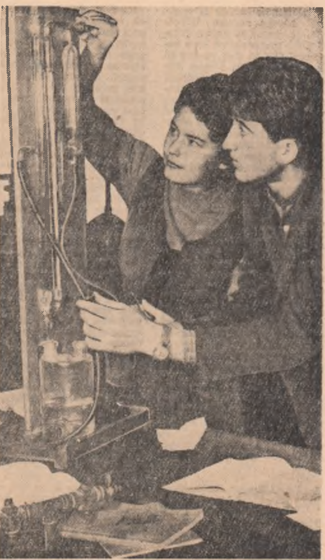
Experimentind, cunoștințele teoretice se însușesc mai temeinic. În fotografie, un aspect din laboratorul de pedologie al Institutului agronomic din București.