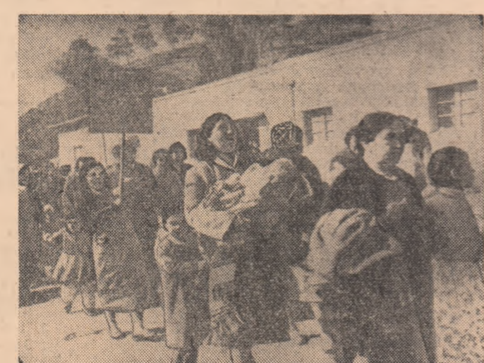
Mișcarea grevistă din Chile este într-o permanentă creștere. La sfîrșitul anului 1960, 600 de mii de muncitori chileni au declarat grevă generală. Autoritățile au recurs la singura măsură impotriva oamenilor muncii din orașul Santiago, care manifestau pentru satisfacerea revendicărilor lor economice: numeroși muncitori au fost uciși. Fotografia din dreapta reprezintă un aspect de la o demonstrație a oamenilor muncii chileni. Soțiile și copiii muncitorilor din Chile au participat și ei la demonstrațiile pentru îmbunătățirea condițiilor de viață, organizînd un marș pe o distanță de 20 de kilometri (fotografia de sus).

Reprezentantul Ministerului Muncii al Angliei a declarat că în prezent este mult mai greu să găsești de lucru decît în lunile trecute.