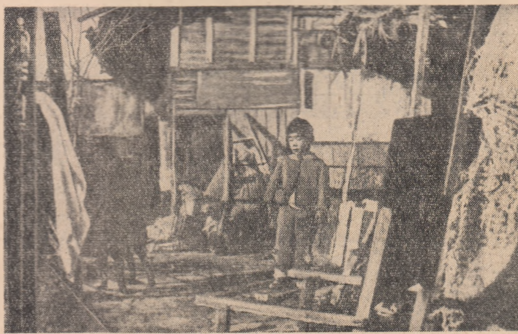
Masele populare din Coreea de Sud trăiesc într-o cruntă miserie. Iată cum arată o „locuință” a unei familii de muncitori din Seul.