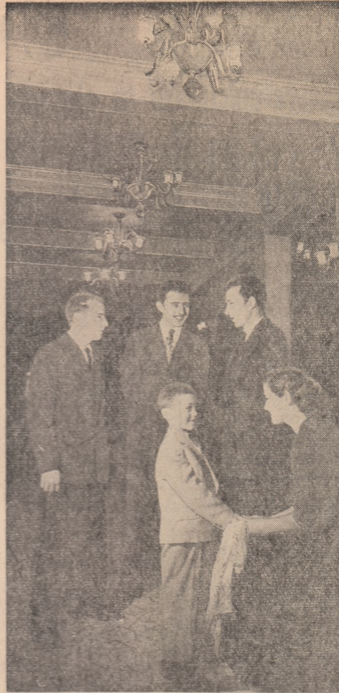
Tineri, oțelari hunedoreni la teatru.

Concurs-ghicitoare în ajutorul tinerilor care doresc să participe la concursul „Iubiți cartea”