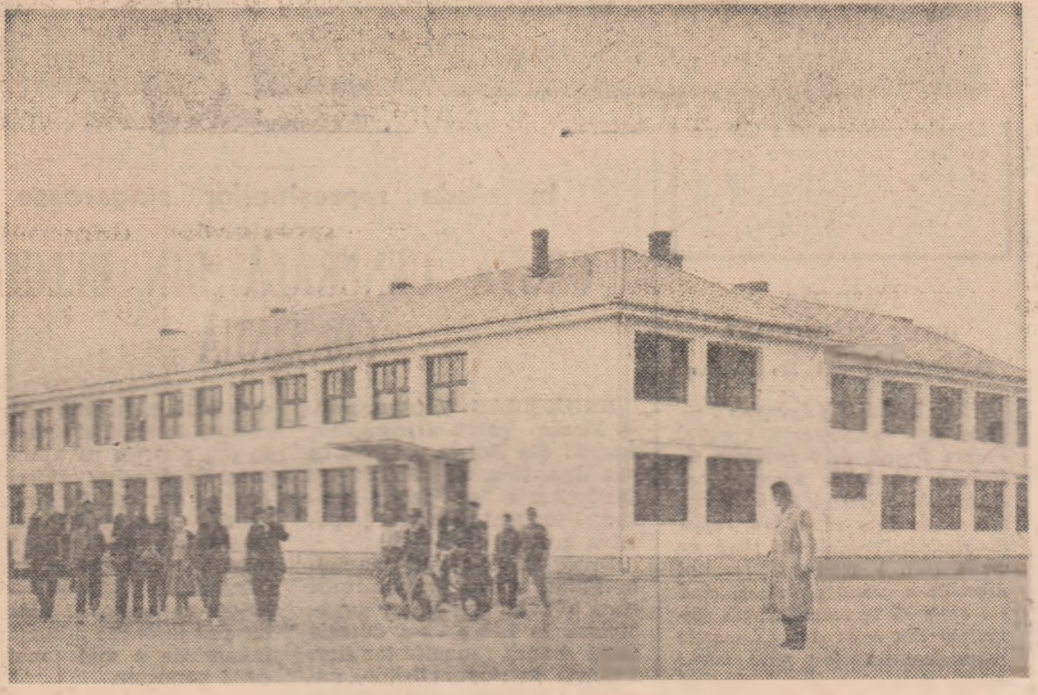
Noua Școală medie din Videle (regiunea București).