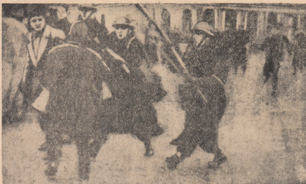
În Hyde Park din Londra a avut loc o demonstrație de protest împotriva uneltirilor colonialiste în Congo. Demonstranții au cerut imediat eliberarea a lui P. Lumumba.