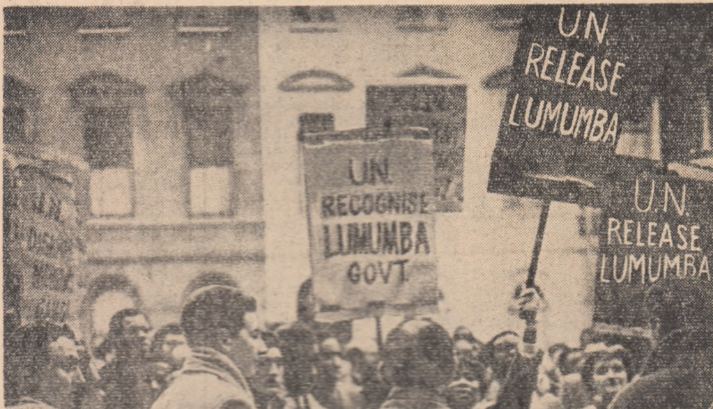
În Hyde Park din Londra a avut loc o demonstrație de protest împotriva uneltirilor colonialiste în Congo. Demonstranții au cerut imediat eliberarea a lui P. Lumumba.