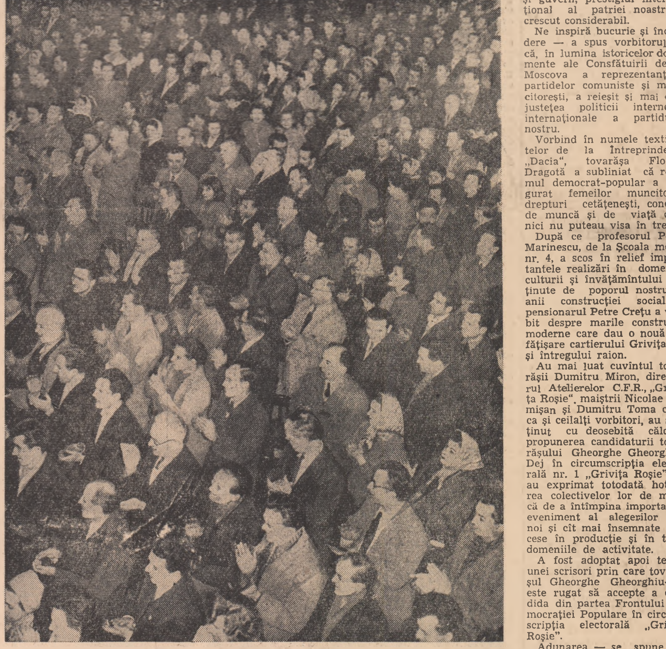
Un aspect de la entuziasta adunare de la „Grivița Roșie”.

Capacitatea totală anuală a fabricii va fi de 3.000 tone lapte praf, produse dietetice pentru copii, unt etc.