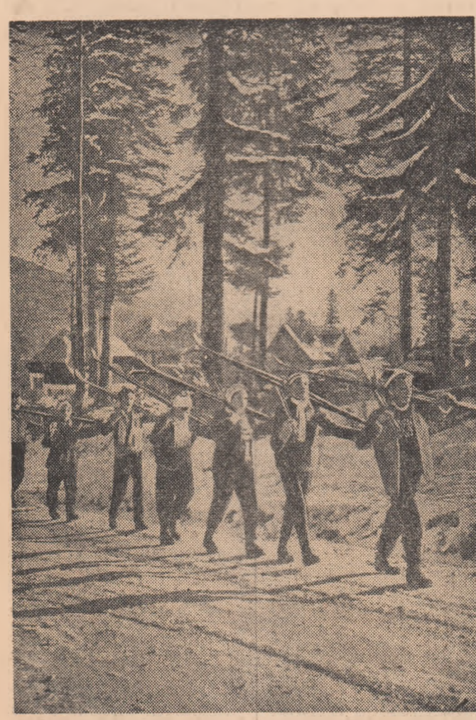
În drum spre pirtia de schi.

Ată de ce, la biroul organizației de partid s-a discutat la începutul anului trecut „problema” sudorilor. — Dacă continuă să muncească așa, nu ne vom realiza nici planul, nici angajamentul de economii. Ne vom face de rușine în întrecerea cu celelalte sectoare — spunea secretarul organizației de partid.