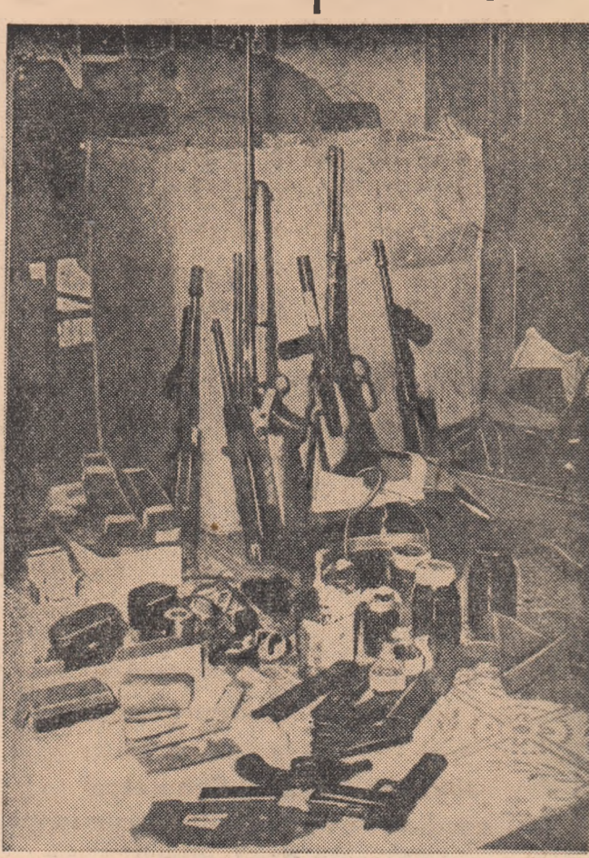
O parte din armamentul și echipamentul de proveniență americană găsit asupra bandei de contrarevoluționari creșteați de autoritățile

HAVANA 10 (Agerpres). — Ziarul „Revolucion” publică date apărute în revista americană „National” despre pregătirile care au loc pe teritoriul Guatemalei în vederea bombardării rafinăriilor de petrol din Cuba. Piloții care consimt să arunce bombe de fabricație americană asupra acestor uzine primesc câte 25.000 de dolari.