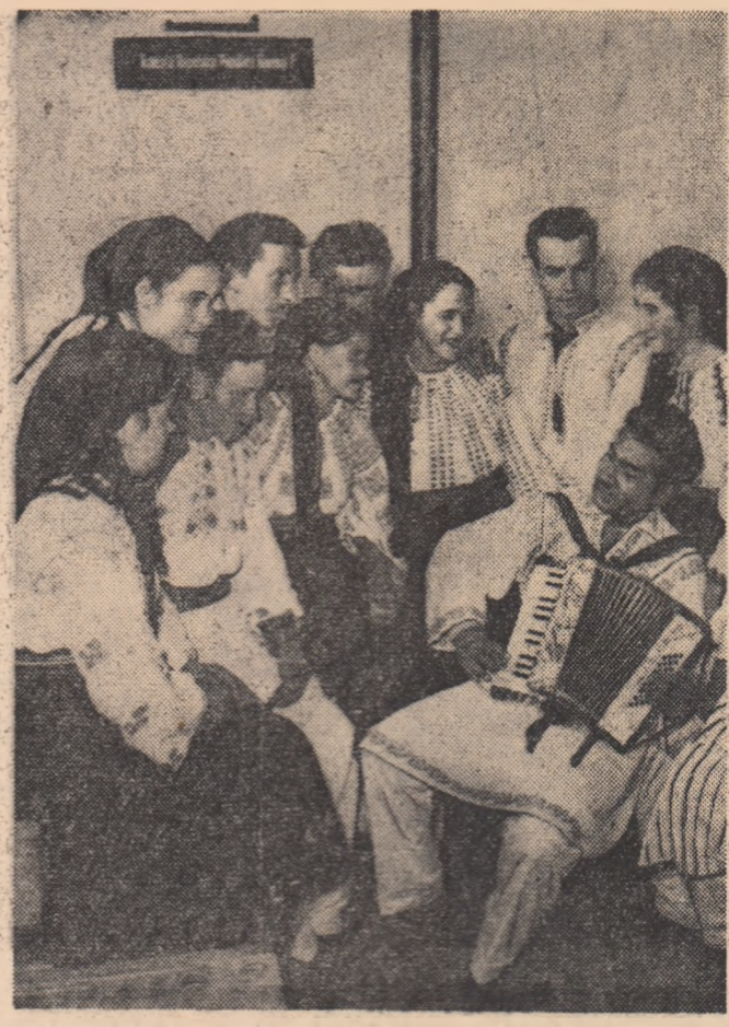
Înainte de intrarea în scenă, artiștii amatori din comuna Giugiova, regiunea Oltenia, fac ultimele "retusuri".