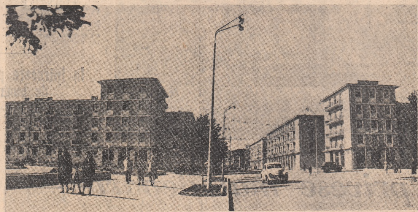
Galațiul devine pe zi ce trece tot mai frumos. Elegantele blocuri construite recent împodobesc orașul. Iată în fotografie un aspect din centrul Galațiului.