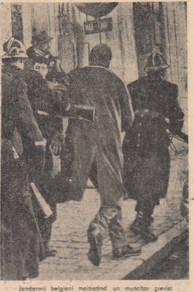
Jandarmii belgieni mărșăluind un muncitor grevist la putere, care demisia imediată a acestui guvern și dizolvarea parlamentului înainte de discutarea în senat a „le-