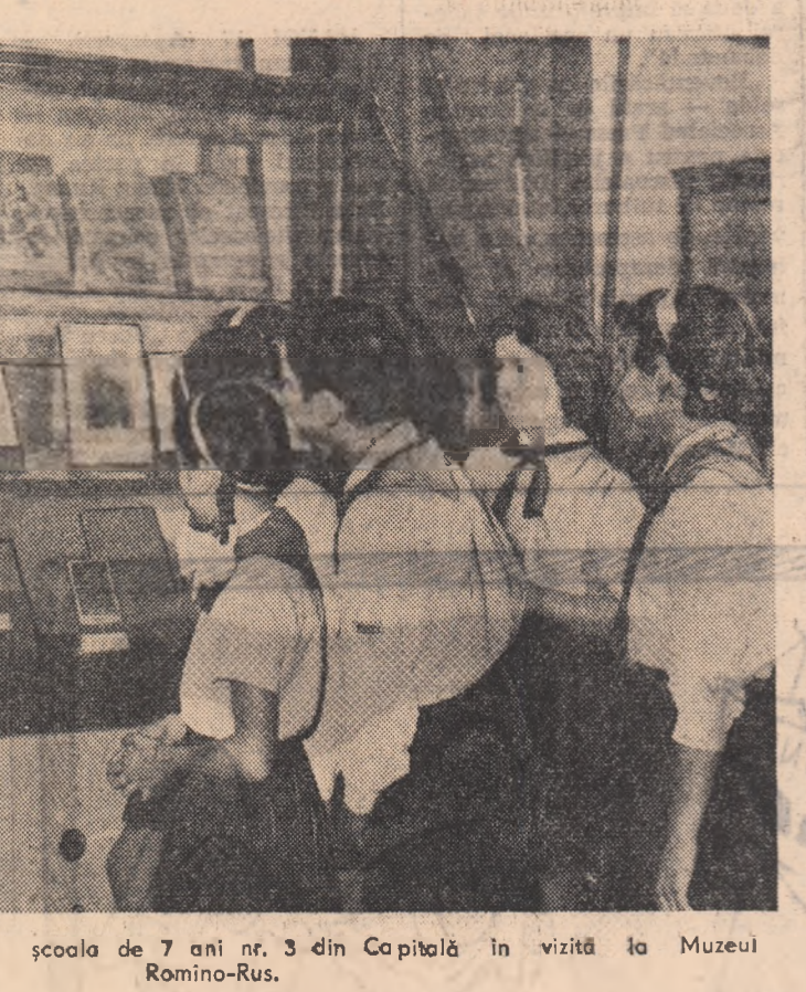
Un grup de pionieri de la școala de 7 ani nr. 3 din Capitală în vizită la Muzeul Romino-Rus.

De cîteva zile în cartierul Dimitrov din Petroșeni a început construcția a 3 blocuri noi, la parterul cărora s-a prețburat să se deschidă și unități comerciale. În noile cartiere muncitorești din Petroșeni, Vulcan, Lupeni și Paroșeni vor fi construite în acest an alte 448 noi apartamente. În ultimii ani, pentru mînerii din Valea Jiului au fost construite 2.976 de apartamente. În afară de acestea s-au dat în folosință 13 cămine muncitorești cu 2.590 de locuri, un spital nou la Lupeni, 4 cinematografe cu 1.400 de locuri, numeroase școli, dispensare, policlinici etc.