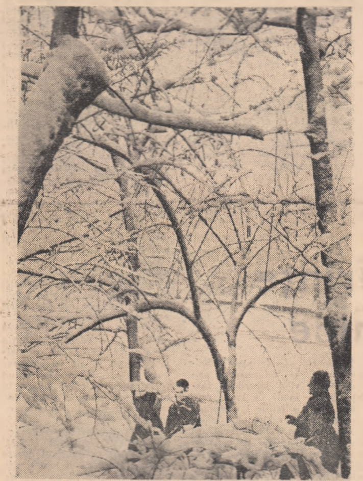
În mijlocul... iernii.