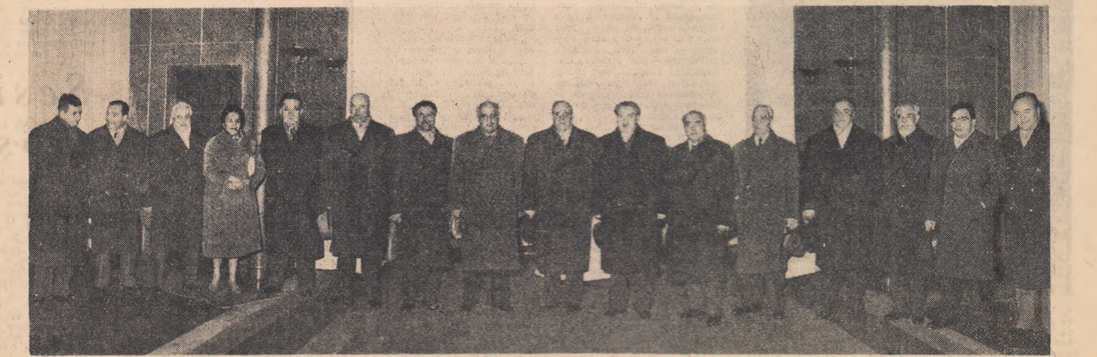
Pe peronul gării Băneasa, în seara zilei de 20 ianuarie, la plecarea oșpetilor bulgari spre patrie. Tovarăși Tudor Jivkov, Anton Iugov și Dimițar Ganev, împreună cu tovarășii Gheorghe Gheorghiu-Dej, Chivu Stoica, Ion Gheorghe Maurer și alți conducători de partid și de stat.