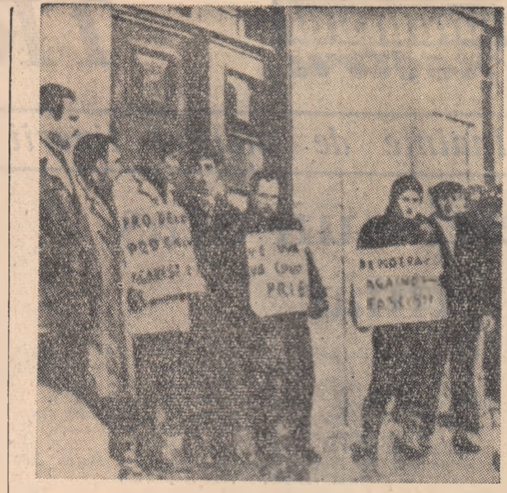
Un grup de portughezi care trăiesc în exil în Canada manifestează în fața consulatului american exprimîndu-și simpatia cu insurgenții de la „Santa Maria”. Pe placardele lor se poate citi: „Democrație împotriva fascismului”, „Pentru Delgado împotriva lui Salazar”.