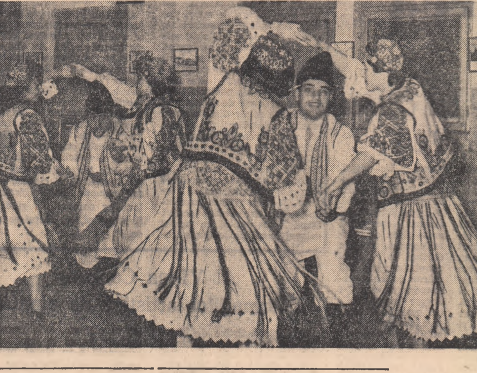
In virtutea jocului. Echipa de dansuri a clubului Uzinelor „Boleslav Bierut” din Capitală repetînd un dans popular cuprins în programul evenimentului de la 5 martie — alegerile.