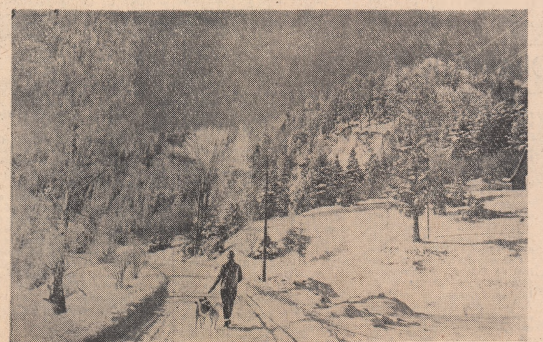
Spre Pirul rece...