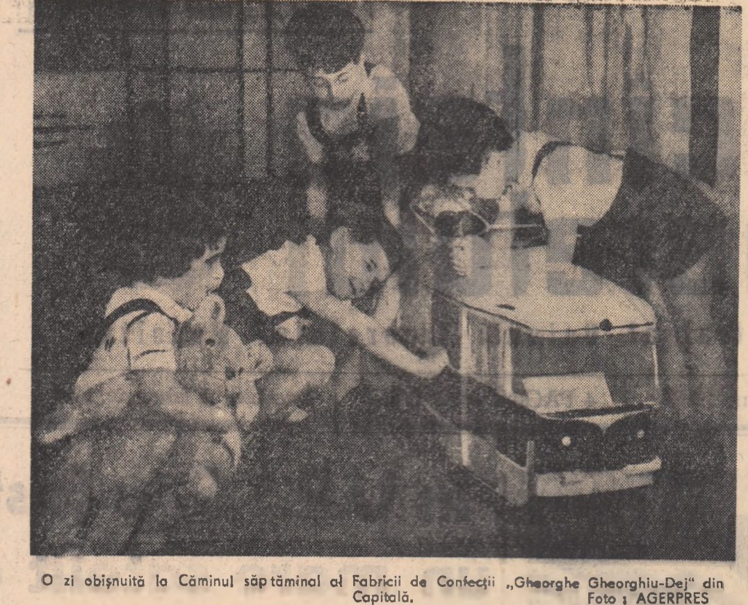
O zi obișnuită la Căminul săptămînal al Fabricii de Confecții „Gheorghe Gheorghiu-Dej” din Capitală.