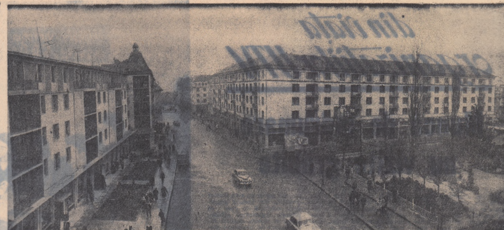
Ca și celelalte orașe ale țării și Craiova a întinerit în anii regimului nostru. În fotografie: blocuri noi pe strada Al. I. Cuza.