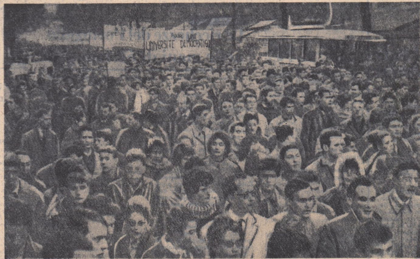
Studenții parizieni împreună cu profesorii lor au manifestat la începutul lunii februarie pe străzile capitalei franceze cerînd „mai multe amfiteatre și mai puține tunuri” și asigurarea unor condiții de studiu pe măsura nevoilor.

Pe lângă pricezarea de a ocolii problemele grele sau de a denatura faptele, redactorii de la „Newsweek” mai au și o extraordinară capacitate de a uita cele scrise de la o pagină la alta.