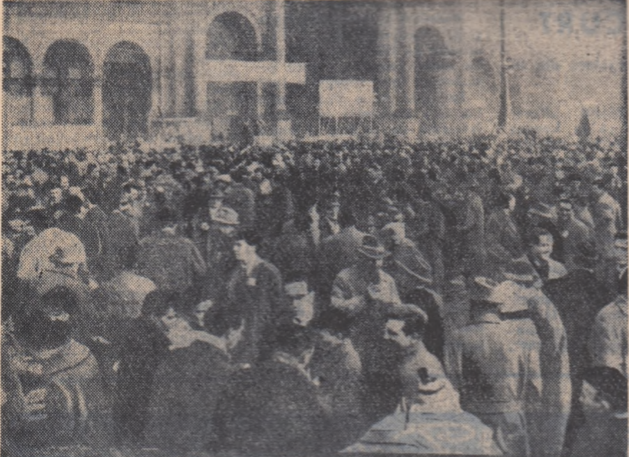
Datorită condițiilor grele de muncă, muncitorii italieni au organizat numeroase greve. Printre acestea, de a turgătorilor din Milano, la care au participat mii de muncitori vînșnici și tineri. Fotografia înfățișează un aspect mîncăoz în rîndul cîtoroa

ted” care primește un „salariu” de 100.000 lire sterline anual, directorii unor filiale ale aceluiași societăți care au un „salariu” de cîte 50.000 lire sterline anual, președintele Societății producătoare de azbest „Turner and New All” cu un „salariu” de 60.000 lire sterline anual, pot spune cu mîna pe inimă că veniturile lor au crescut. Sînt doar veniturile de 250-300 de ori mai mari decît ale unui tînăr muncitor. Cu toate acestea „Newsweek” continuă să afirme cu seninătate despre tineretul englez că acesta ar avea un „surplus de bani”... Desigur, există și asemenea tineri, dar aceștia sînt feciorii de bani-gata, al căror pînăgi pot să joneze în voie cu ocurele. Ei reprezintă o minoritate infimă. Dar marea majoritate a tineretului englez, are acest „surplus de bani” pentru a-și procura „tot ce dorește”? Să apelăm la faptele. Uniunea Națională a Studenților din Anglia a efectuat recent un studiu asupra condițiilor de locuit ale studenților englezi. S-a constatat cu această ocazie că mulți dintre studenții din țara lui Dickens trebuie să se mulțumească cu locuințe în becuri părăsite sau autobuse scoase din uz. Să-și alegă oare acești tineri asemenea locuințe pentru motivul că au „surplus de bani”?