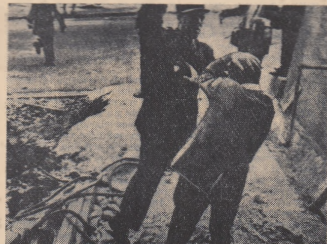
Tineretul francez se pronunță cu hotărîre împotriva războiului din Algeria. Autoritățile colonialiste franceze reprimă brutal aceste manifestații. Fotografia noastră înfățișează o scenă tipică: un jandarm lovește în mod bestial un student care împreună cu un grup de colegi a manifestat împotriva fascismului și pentru pace în Algeria.

Împotriva planurilor aventuriste ale militaristilor se pronunță de asemenea tinerii din Franța, Anglia, Belgia, Italia și din alte țări occidentale. Aceștia organizează manifestații antiimperialiste, campanii de strîngere de semnături pentru pace și altele. Ei sînt acei tineri care și agonisesc trairul prin muncă, tineri care vîd la ce marșam duce „modul de viață capitalist”. Ei se opun cu fermitate poliției înarmărilor atomice, bazei militare străine alături de căminele lor. Ei doresc pace, fiindcă știu că tînără generație are nevoie de mai multe școli și nu de închisori mai încăpătoare. Astfel tineretul englez cere forme de