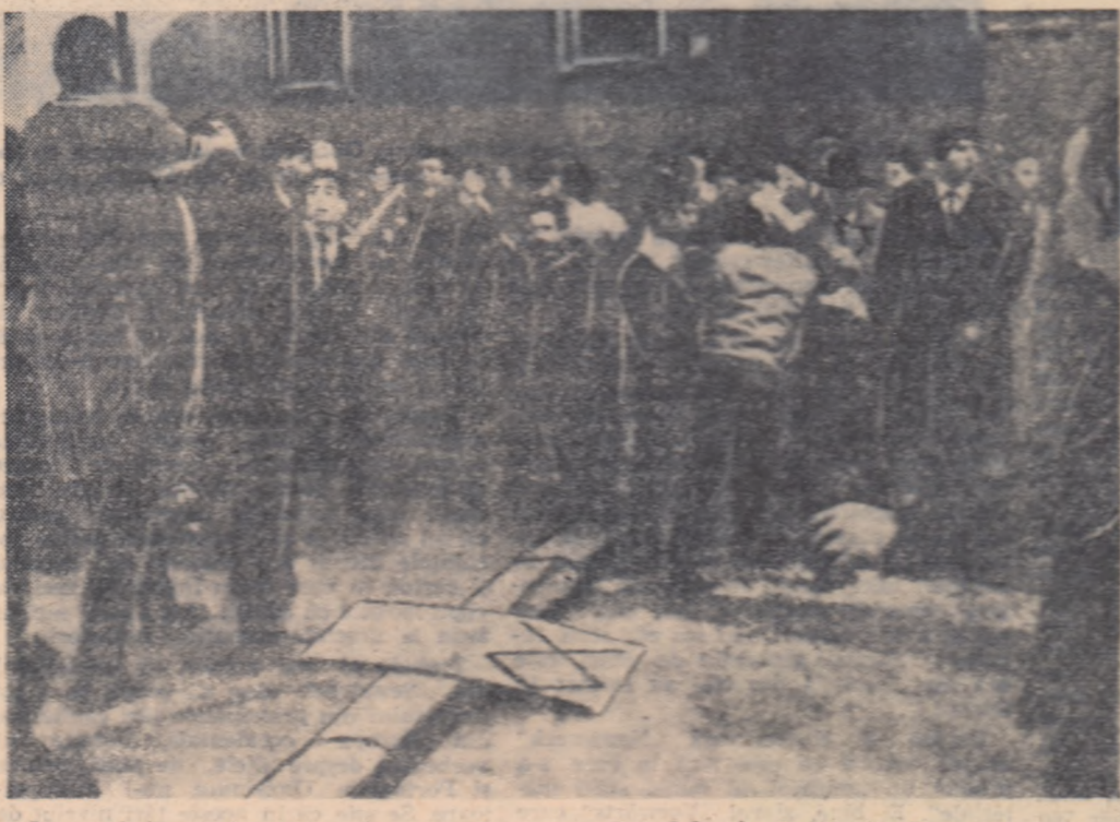
Recent, huliganii fasciști au încercat să atace sediul C.C. al Partidului Comunist Italian. Muncitorii din Roma le-au dat fasciștilor riposta meritată, punîndu-i pe fugă.