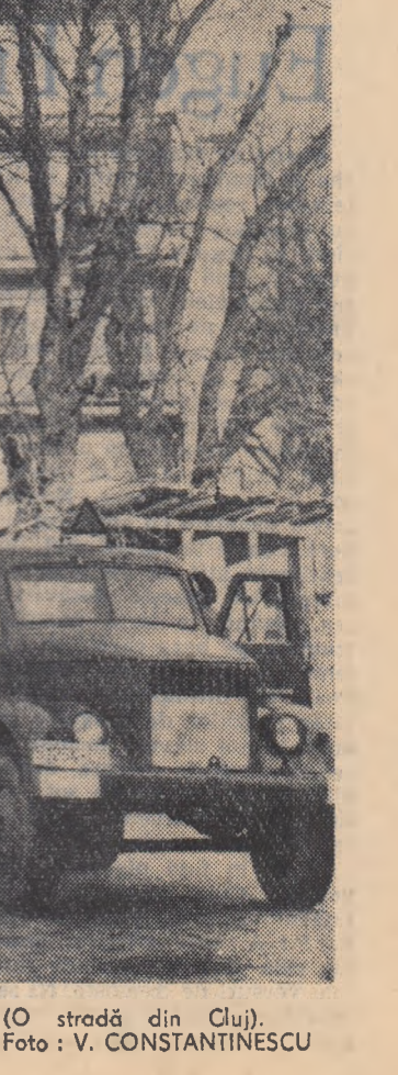
Cartier nou, lumină nouă. (O stradă din Cluj).

Asăzi se deschide în Capitala patriei noastre Conferința pe țară a Societății pentru Răspîndirea Științei și Culturii, conferință care va debata și va lua hotăriri importante pentru creșterea continuă a activității Societății. Cu prilejul deschiderii Conferinței pe țară a Societății pentru Răspîndirea Științei și Culturii, tineretul țării noastre adresează conferinței deplin succes, urează Societății noi și noi succese pe calea răspîndirii în mase a politicii partidului pe calea înarmării maselor largi ale oamenilor muncii, ale tineretului nostru, cu profunde cunoștințe politice, științifice, culturale.