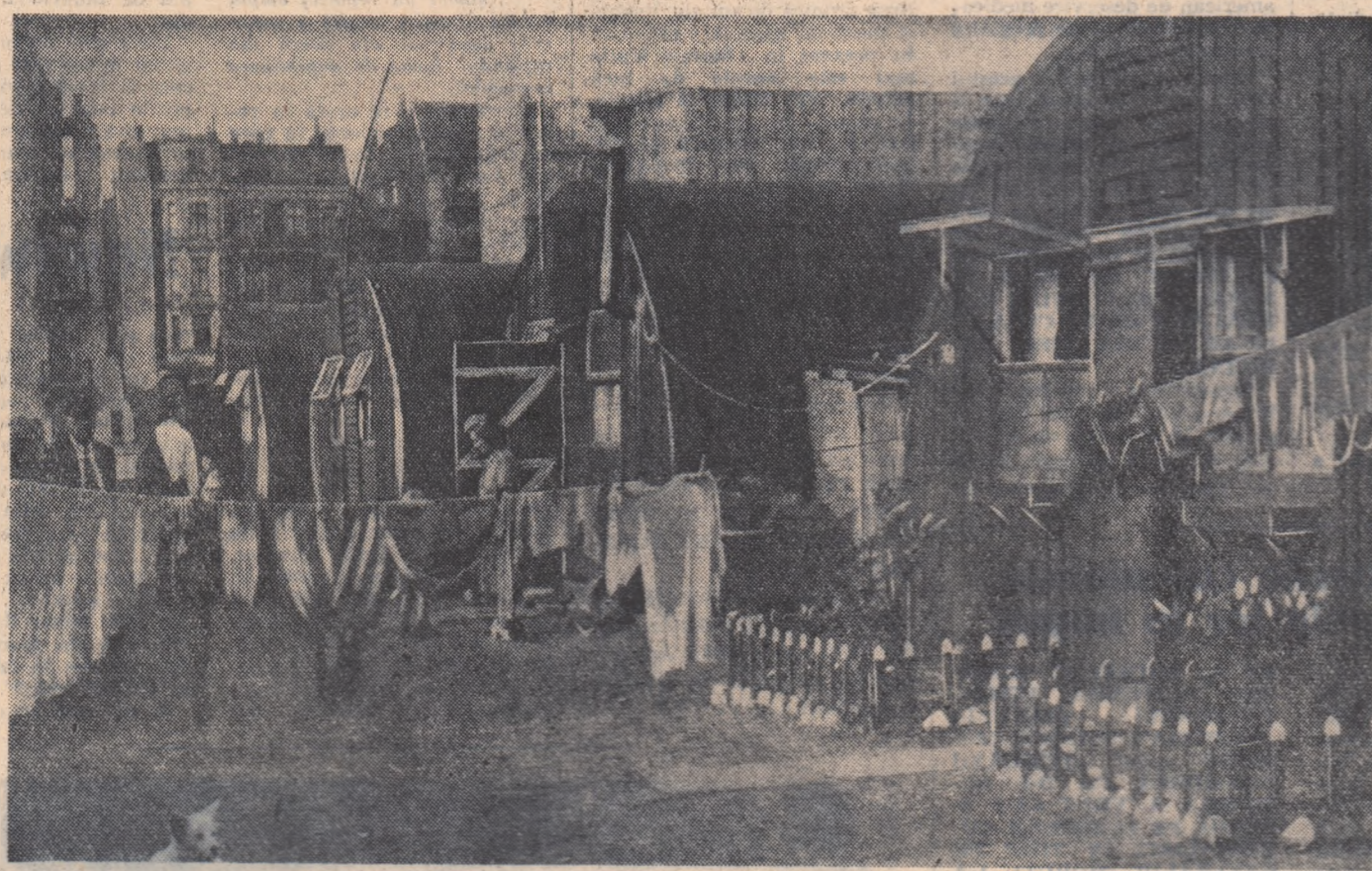
În aceste bordeie locuiesc muncitorii din Hamburg. Oficialitățile vest-germane au declarat însă că tinerii pot părăsi aceste „locuințe” pentru a se muta în... cazarmile oferite de Strauss, adică de a se înrola în Bundeswehr.

Chiar de la început, articolul din „Newsweek” afirmă fără ezitare: „Noua generație de tineri este cea mai înrădăcinată din cîte au existat în Europa. Ea este cea mai sănătoasă generație, cea mai bine educată...”. Ce mai încoace, par a spune autorii, tineretul vest-european nu mai poate de aștia îmbelșugare! Și ajung pînă acolo încît afirmă că tinerii devin delinvenți... datorită îmbulțirii. Referindu-se la Anglia, articolul reproduce declarația unui om de afaceri care afirmă că în ultimii ani salariile tinerilor au crescut mai mult decît costul vieții și, în consecință, nivelul de trai al tineretului s-a ridicat. De la un patron nici nu ne puteam aștepta la alt răspuns. Altul ar fi fost însă răspunsul dacă ci întrebare ar fi fost unul dintre tinerii muncitori care lucrau la patronul cel mulțumit de sine. Căci în Anglia în timp ce un muncitor adult, lucrînd tot anul și fără să-și ia concediu, câștigă doar 700 de lire, o muncitoare 377 lire, iar tinerii și tineretele și mai puțin, patronii se lăfăiesc în belșug și huzur. Astfel, directorul societății de automobile „Jaguar Cars Limited”