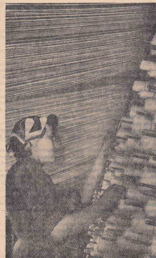
Tov. Andreescu Vasilica de la Întreprinderea de plase și unelte pescărești din Galați, a ieșit pe locul 1 la concursul pe profesii. Ea a depășit planul de producție pe luna ianuarie 1961, cu 3,2 la sută.