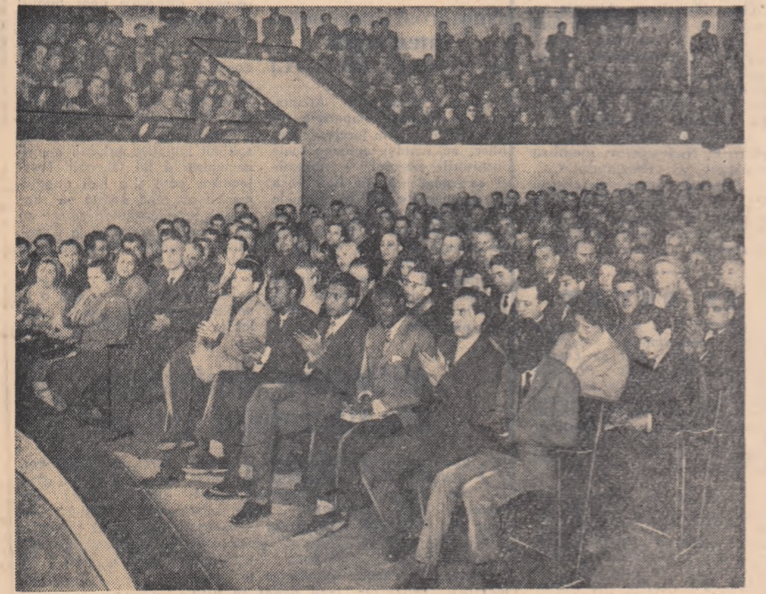
Un aspect din timpul adunării de protest a oamenilor muncii din Capitală.

recunoaște că este necesară înlăturarea lui D. Hammarskjöld din postul de secretar general al O.N.U. deoarece a fost complice și organizator al răfuitului cu oamenii de stat din Republica Congo.