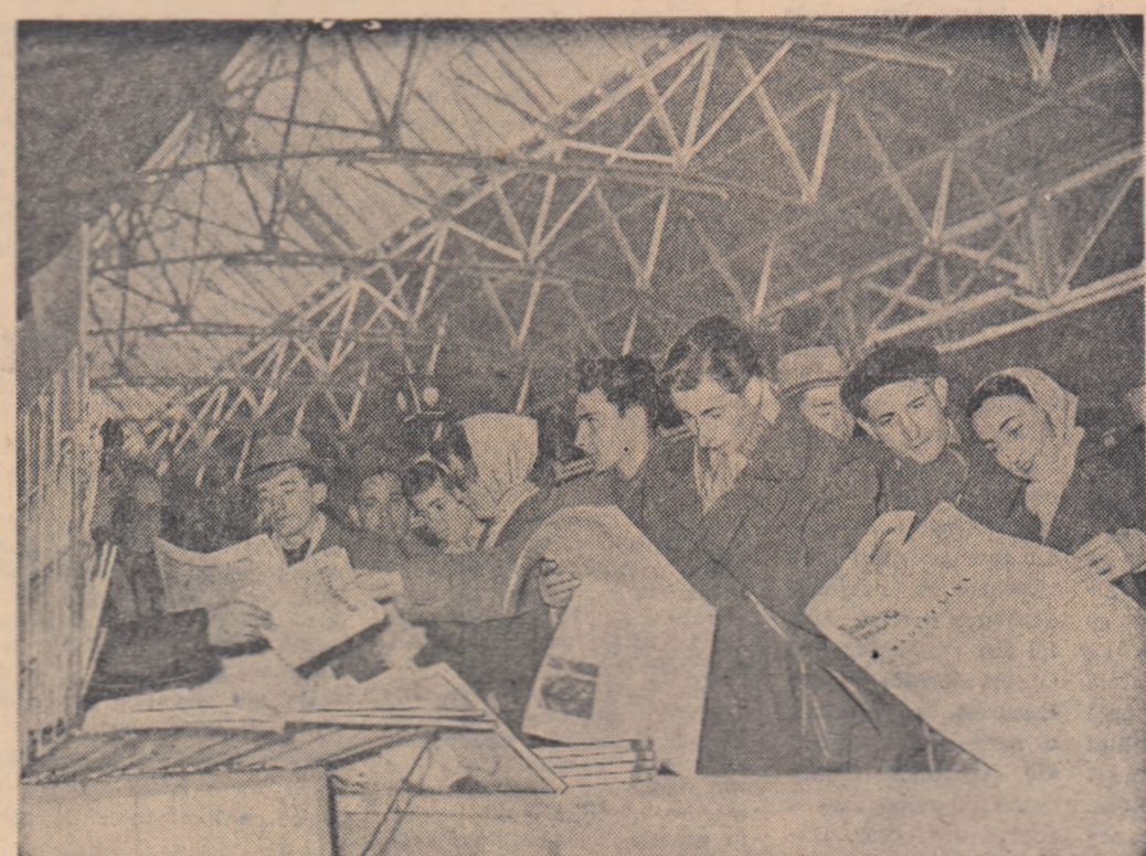
Deindată ce-au sosit ziarul care publicau în prima pagină Manifestul F.D.P., și aici, la chiocșul din Gara de Nord, există o animație deosebită.

— În întreaga țară oamenii muncii au primit cu deosebit entuziasm și încredere Manifestul Consiliului Central al F. D. P. —