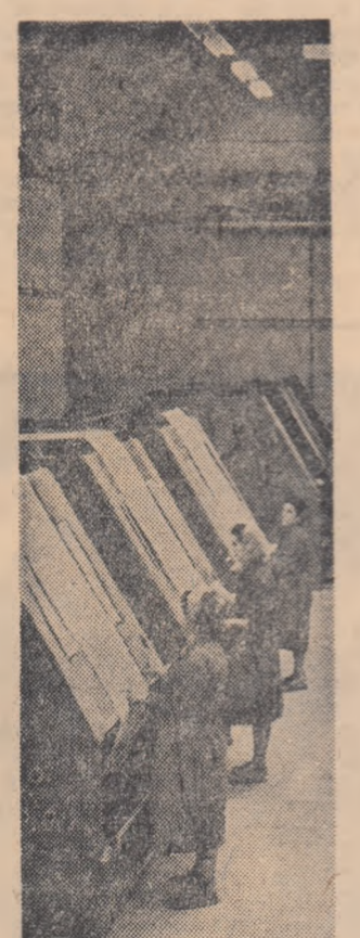
Dotată cu utilaj de înaltă tehnicitate, noua secție de finisaj de la întreprinderii „Decia” din Capitală va prelucra anual circa 30.000.000 m. țesături diferite.